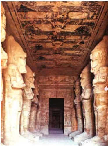
Glavna sala Abu Simbela

teren, jer je nivo jezera Naser počeo da se diže posle završetka Asuanske brane. Veliki hramovi Abu Simbel posvećeni su Ramzesu II, čija statua sedi sa još tri boga u unutrašnjosti hrama uklesanog u stenu. Fasodom hrama dominiraju četiri ogromne faraonove sedeće statue, od kojih je jedna oštećena u drevnim vremenima. Unutrašnjost hrama Abu Simbel ima izgled pećine koju je čovek izdubio u samoj steni.