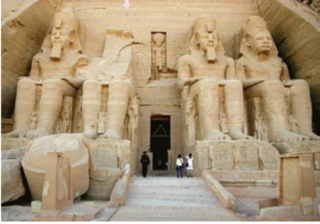
Veliki hram Abu Simbel

Hramove Abu Simbel sagradio je 1257. godine pre n.e. faraon Ramzes II (1279-1213), blizu granice Egipta i Sudana. On je podigao dva hrama, koji su bili uklesani u stenu, na zapadnoj obali Nila, južno od Asuana, u Nubiji. Hramovi Abi Simbel bili su uklesani u stenu, ali su 1960-tih godina premešteni na viši