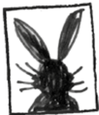
EN DŽANIN MURTA

MAJSTORI SKRIVANJA KOJIMA DUGUJEM ZAHVALNOST: