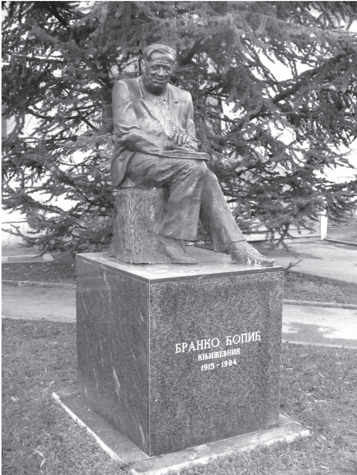
Споменик у бањалучком парку

је распаљивало Бранкову машту. У његову главу су почели улазити змајеви, виле, дивови, патуљци, вампири, чаробњаци, јунаци. У свим тим причама потпомагао је и деда Раде.