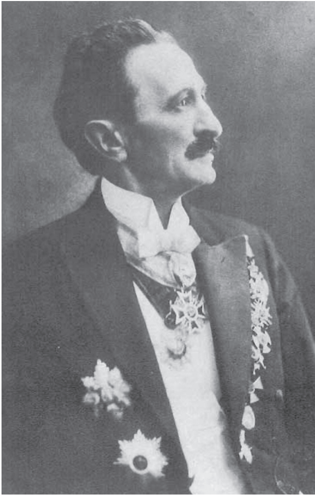
Бранислав Нушић у свечаном оделу са одликовањима

Али то га је одобровољило, па је младом комедиографу и песнику обећао службу. Ускоро је постављен за писара српског конзулата у Приштини.