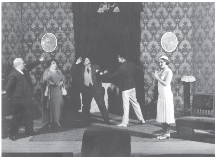
Сцена из представе Проекција , 1934.

Нушић је са само деветнаест година написао Народної ѿсланика . Једног јесењег дана, у башти под великим орахом, читао је ту комедију неколицини пријатеља. Били су одушевљени. Ипак, није се усудио да рукопис однесе у Народно позориште. Али један његов пријатељ, глумац, однео га је директору позоришта. Овај је драму