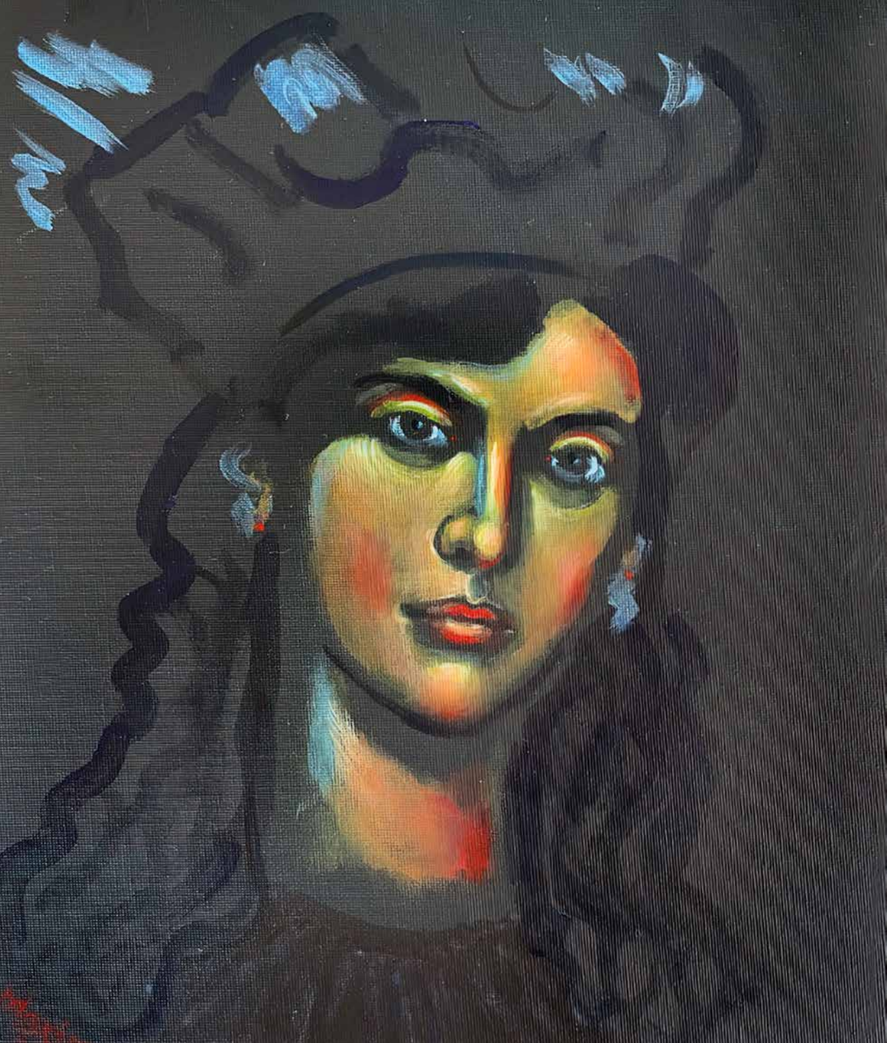
Настасја Филиповна (Идиот), акрил на платну, 2021.