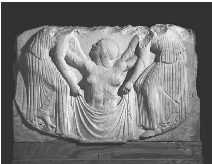
Afrodita, kojoj pomažu dve Hore – boginje koje predstavljaju godišnja doba – izranja iz mora na prestolu Ludovisijevih. Ovaj reljef je gotovo sigurno prvobitno izrađen 480. god. p. n. e. za hram u Lokri, u današnjoj Kalabrijii