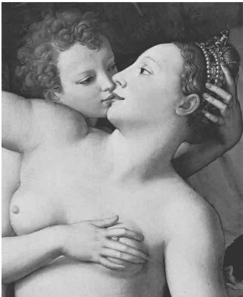
Bronzino, 1540–1546, detalj Alegorije sa Venerom i Kupidonom (takode zvane „Venera, Kupidon, Ludost i Vreme“), ulje na drvetu .