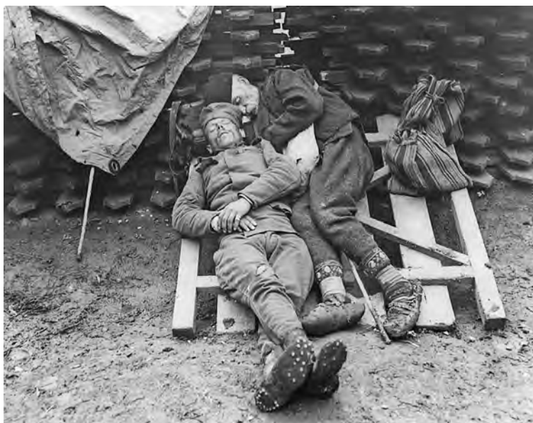
Отац у посети сину војнику, у тренутку одмора, 1914–1915. године

војника јер су и у миру радили и живели са њима и међу њима. Они су, такође, у мирнодопским условима представљали део интелигенције. Блиски са својим борцима, лакше су им преносили своја знања а од њих преузимали животна и борбена искуства.