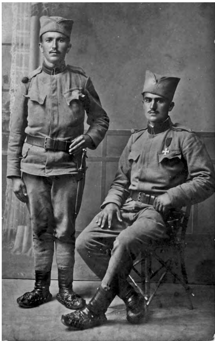
Два редова пешадије у униформи по пропису из 1908. године. Обућу чине опанци. Војник здесна има споменицу рата 1913. године.