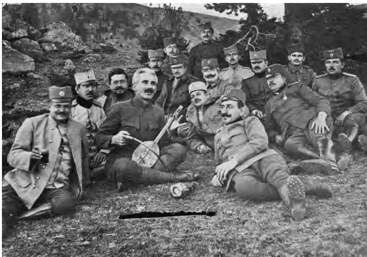
Група официра и војника окупљена око гуслара, Солунски фронт

„Епске песме о Косову, које већ поколењима певају народни певачи уз звуке гусала, и у најзабаченијим планинским долинама и најживљим трговиштима, остају зајед-