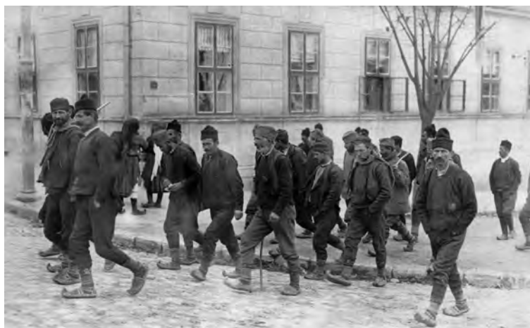
Мобилизација резервног састава, 26. јула 1914. године

Када се говори о српској војсци, треба имати у виду да њени почечи сежу у време Првог српског устанка, када је настала у народу и из народа. Сваки мушкарац способан да носи оружје тада је постао војник. У потпуно аграрној земљи, сељаци су постали први борци а из исте класе израстао је и први командни кадар. Без обзира на нагли напредак земље током XIX века, главна карактеристика официрског кадра била је то што је већином потицао из руралних крајева. У патријархалној средини, официр се поштовао као рођени отац, дисциплина и субординација прихватане су као нешто потпуно природно. Велики значај у ланцу командовања имао је и резервни официрски кадар. Резервни официри још су боље разумевали менталитет и потребе својих