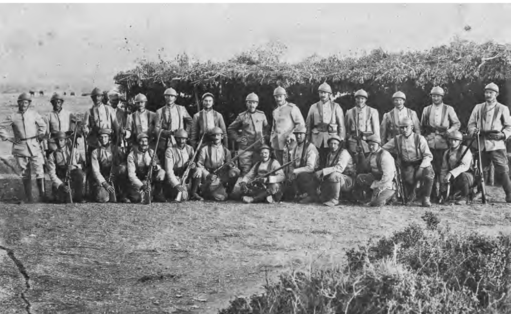
Српска војска на Солунском фронту у француским униформама оризон блу и шлемовима агријан , 1916. године (Народни музеј Ужице)

ским шлемом, што је био израз помирења националног поноса и рационалног поступања. Доминирале су енглеске и француске „каки” униформе које су у неку руку постале синоним „солунаца”. 3