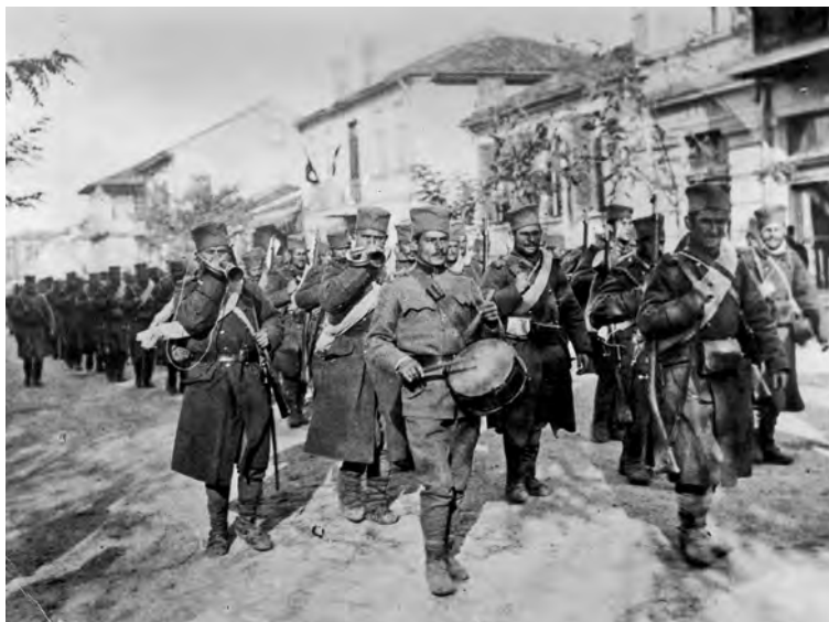
Полазак Седмог пешадијског пука I позива са добошаром и трубачима према фронту, 29. јула 1914. године

бијене су од Француске и Енглеске. Иако су Срби приликом преласка Албаније пренели доста оружја, ипак је сва војска – укључујући и III позив – примила савезничку (првенствено француску) опрему и наоружање, лако и тешко, пешадијско, коњичко и артиљеријско. Српска војска добила је француску и енглеску униформу којој је припадао и лични шлем француског типа М.15 са српским грбом. Не само нова униформа, плаве и „каки” боје, него и француско наоружање, знатно су изменили изглед наших војника на Солунском фронту.