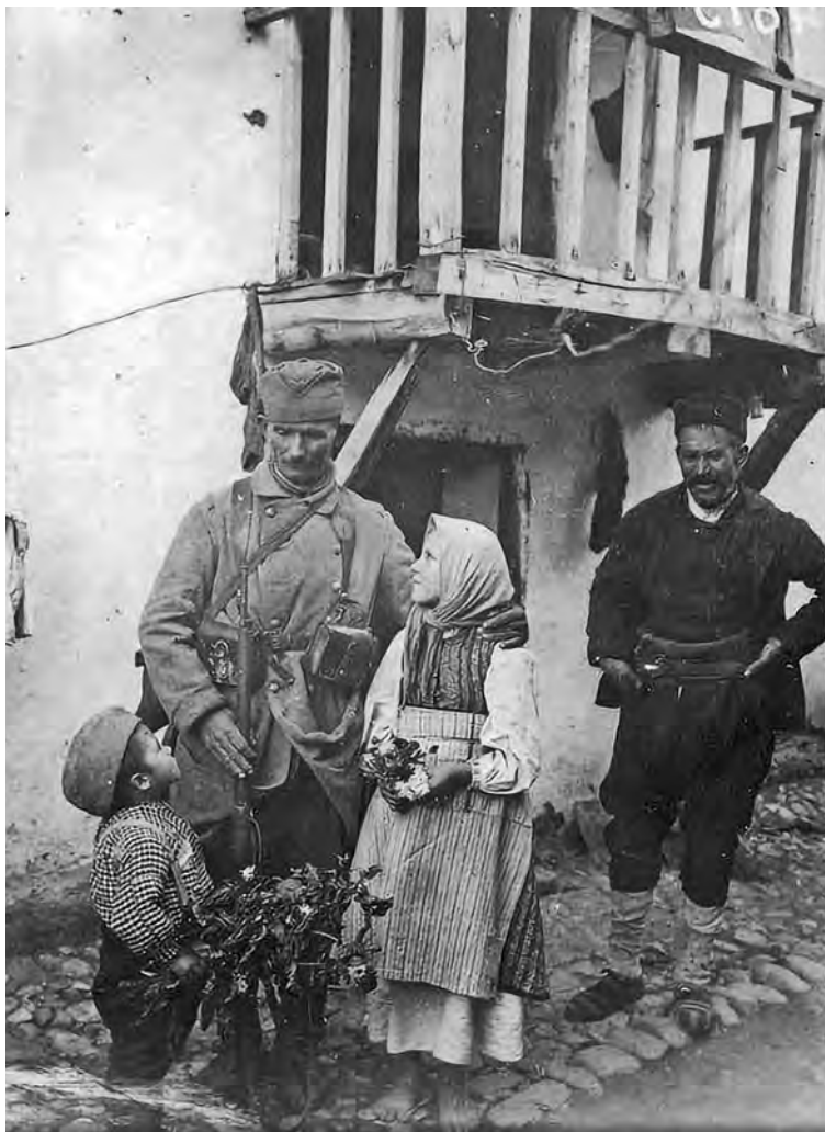
Повратак ратника 1918. године

Из Првог светског рата српска војска је изашла као једна од победничких сила. Због тога ће, у новој епохи, облици српског војног одела, као синоним „успешног оружја” и „победничке војске”, бити основа сваком униформисању.