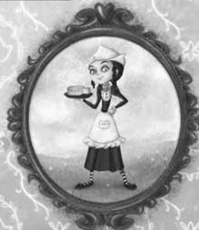
нећаке произвођача сира