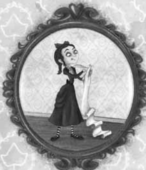
писца петпарачких прича