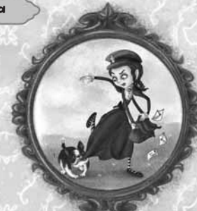
ћерке управника поште