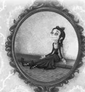
краве на седативима