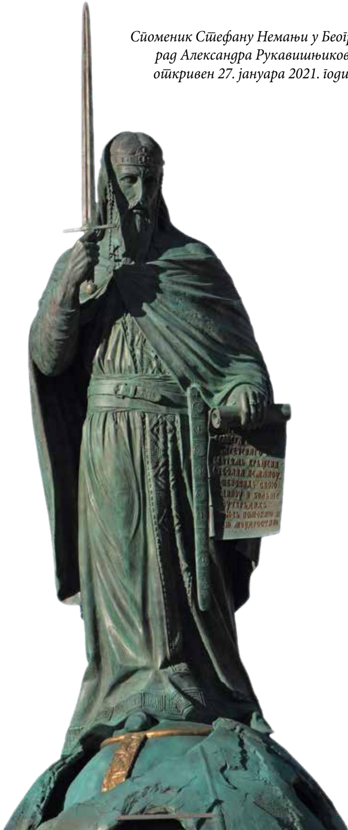
Сјоменик Сјефану Немањи у Београду – рад Александра Рукавишњикова, ошкривен 27. јануара 2021. године