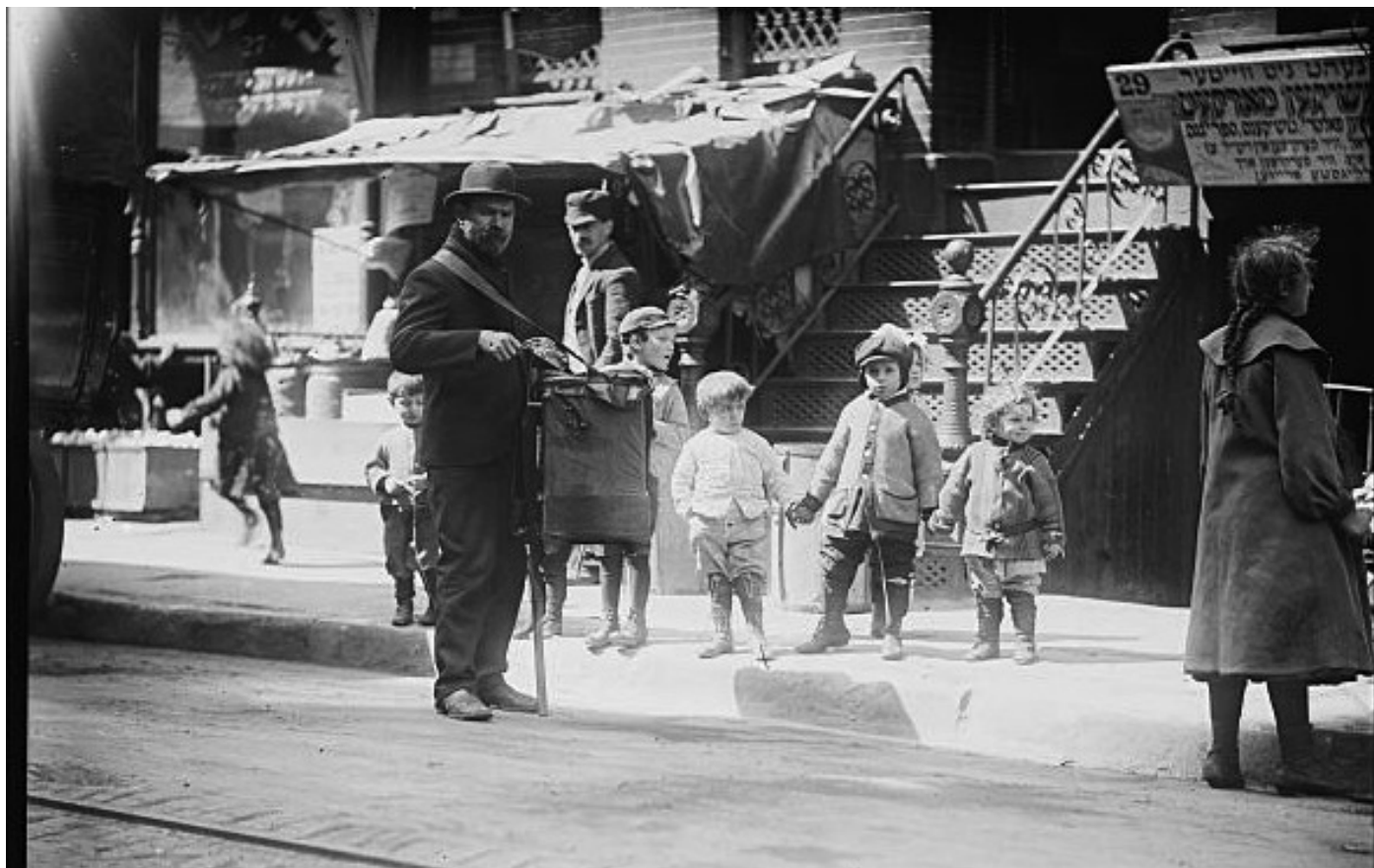
Италијански музичар на улици Њујорка 1900.

ли и услуге наше штампарије. Према нама су увек били коректни и ценили су нас, посебно деду. Неке из моје генерације знао сам још из детињства са улице, а са некима сам ишао у школу. Већина није сретно завршила, многи су добили затворске казне, а неки су страдали у обрачунима.