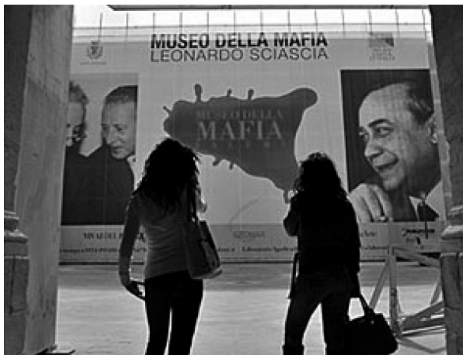
Музеј мафије, Салери, Сицилија

Шта значи реч мафија данас? Толико често се употребљава овај појам, посебно одомаћен у медијима, да је изгубио своје основно значење: нарко мафија, грађевинска мафија, фармацевтска мафија, политичка мафија... Какве то има везе са нама? Углавном се користи да означи неку повезану организовану групу која се бави криминалом или јој економски и политички положај и везе дозвољавају да избегава