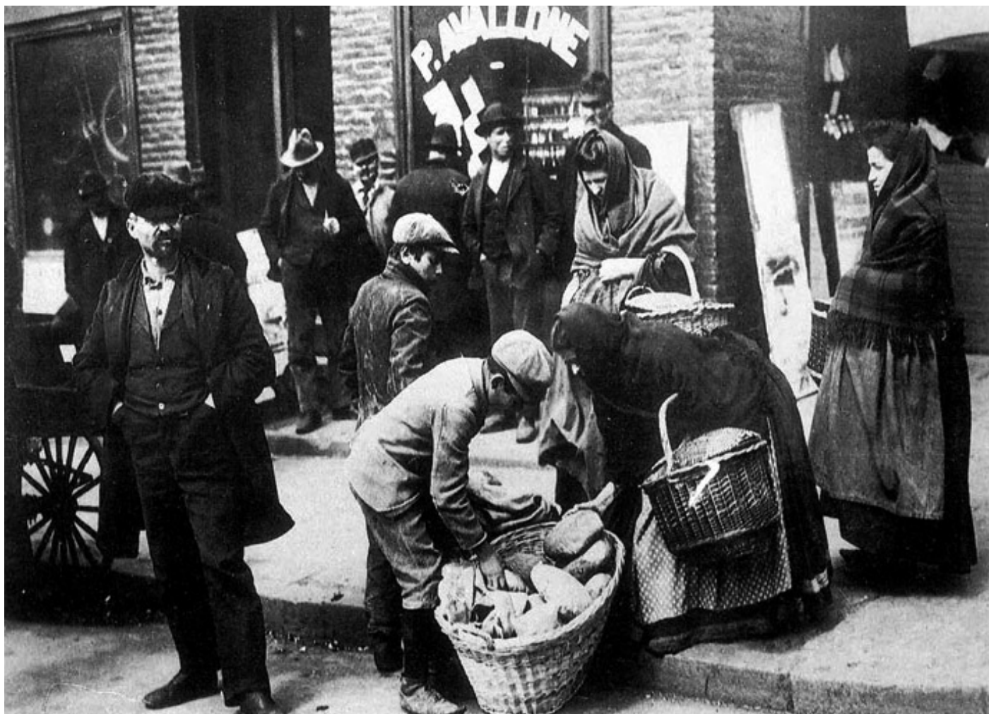
Италијански емигранти крајем 1900.

Виђали смо се и у италијанским ресторанима, који су били прави храмови културе сицилијанске кухиње и где смо породично волели да идемо. У њима се није само јело, већ „живело“. Такав однос према италијанским рес-