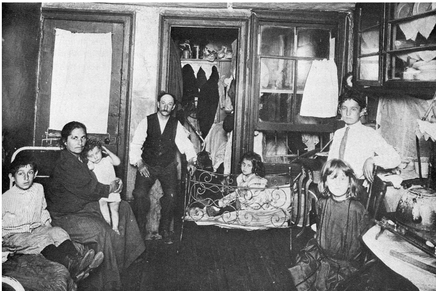
Сицилијанска породица крајем 19. века у Америци

Захваљујући дедином капиталу отац је отворио нашу штампарију. Није нам лоше ишло и могли смо да живимо сасвим пристојно. Мој рођени брат је бравар, има сопствену радионицу за поправку брава и нарезивање кључева. Ја сам завршио финансије на Њу-