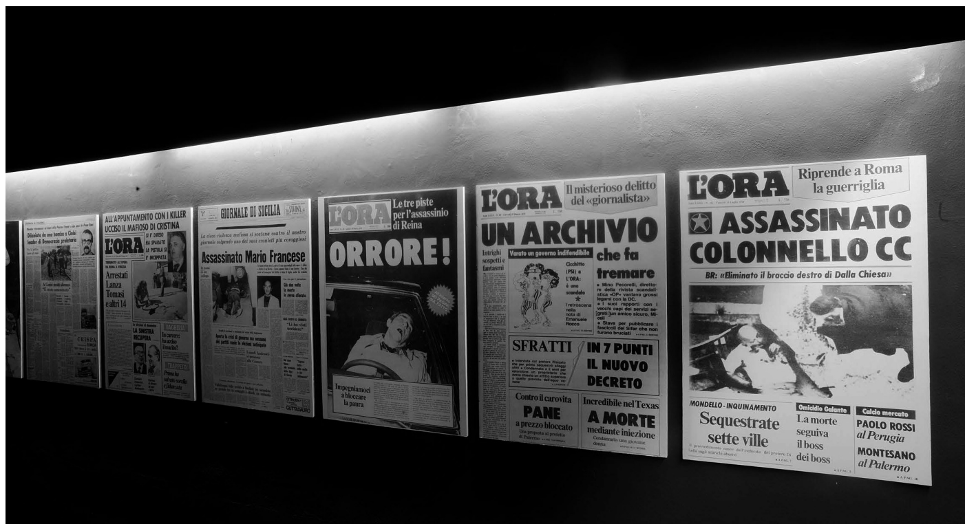
Музеј мафије, Салери, Сицилија

(контролише) државну регулативу. Међутим, једино изворно значење, и једино тачно, повезано је са Сицилијом – сицилијанска мафија.