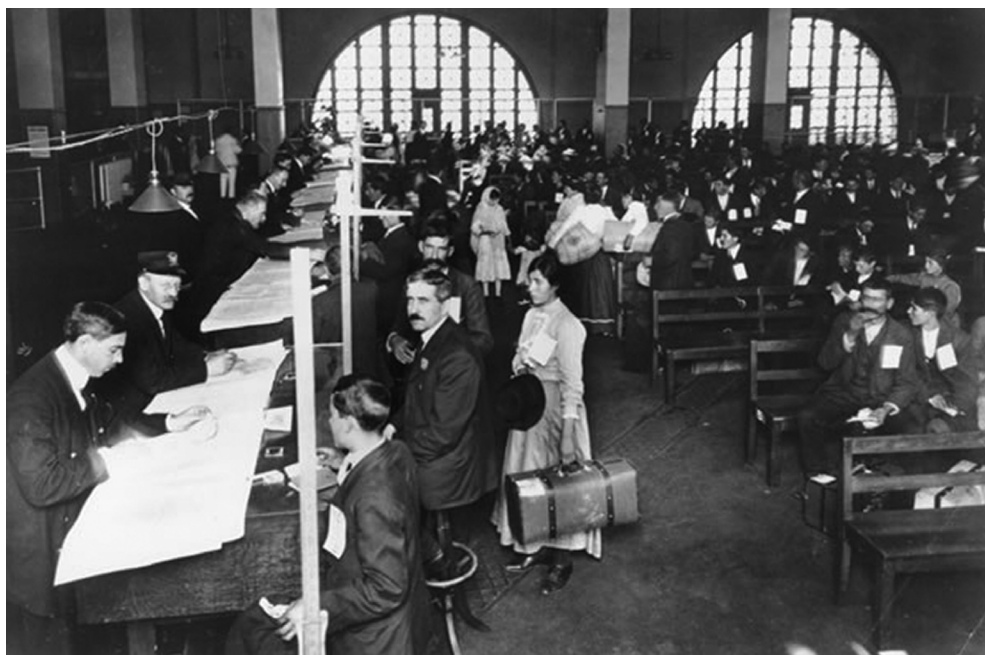
Прихвални центар за Сицилијанце и све друге емиграната из Европе од 1882. до 1945. године налазио се на острву Елис код Њујорка. Процена је да више од 40 одсто данашњих Американаца води порекло од оних који су прошли кроз овај прихвални центар.