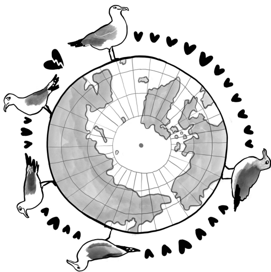
Prstenasta vrsta galebova iz roda Larus

različito, oni tada prema nekim konceptima bioloških vrsta pripadaju istoj vrsti. Ali ako organizam B može da se pari i s organizmom C, to znači da sva tri organizma pripadaju istoj vrsti, osim što u prstenastim vrstama organizam C ne može da se pari s organizmom A, što znači da su različita vrsta. Sve ovo postaje veoma komplikovano, a naša definicija vrsta počinje da se ruši. Naročito ako imamo u vidu da najnovija genetska proučavanja prstenaste vrste Larus pokazuju da se možda zapravo radi o dva ili više ogranka, nalik na uvijene špagete, povezanih vrsta koje se međusobno pare i daju plodno potomstvo, a ne o prstenu.