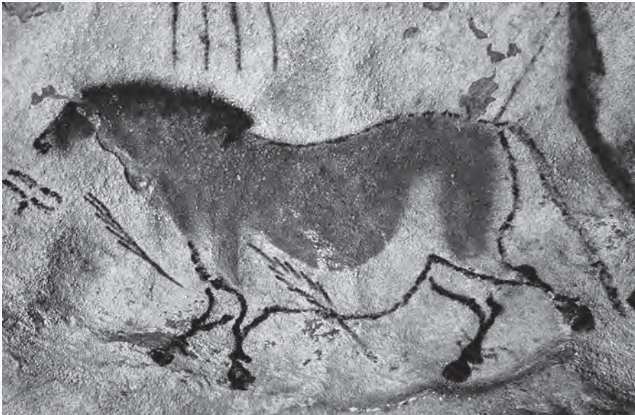
Pećinska slika, Lasko, oko 15.000 p. n. e.

grančicama, mahovinom ili četkama od krzna. Mnoge slike životinja su kopirane s mrtvih modela. Naturalistički pristup, često prikazivanje životinja probodenih strelama ili kopljima, nehajno preklapanje crteža i njihov položaj u najnedostupnijim delovima pećine sugerišu da je stvaranje tih slika bilo magijski obred kojim će se obezbediti uspeh u lovu.