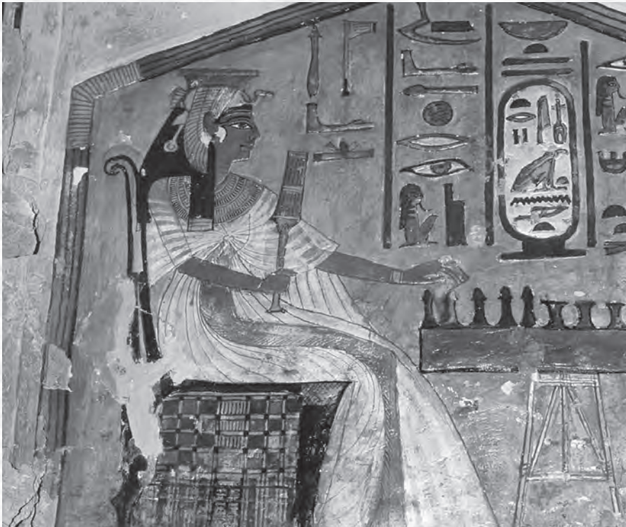
„Kraljica igra šah”, Nefertarina grobnica, Teba, oko 1255. p. n. e.

trup i oči su prikazani spređda, a glava, ruke i noga sa strane. Figure igre takođe se vide sa strane, u svom najprepoznatljivijem obliku. Hijeroglifi u okviru slike nude bajalicu namenjenu da preobrazi Nefertari u pticu, čime će joj pomoći da napusti ovozemaljsko telo i započne zagrobni život kao besmrtnica.