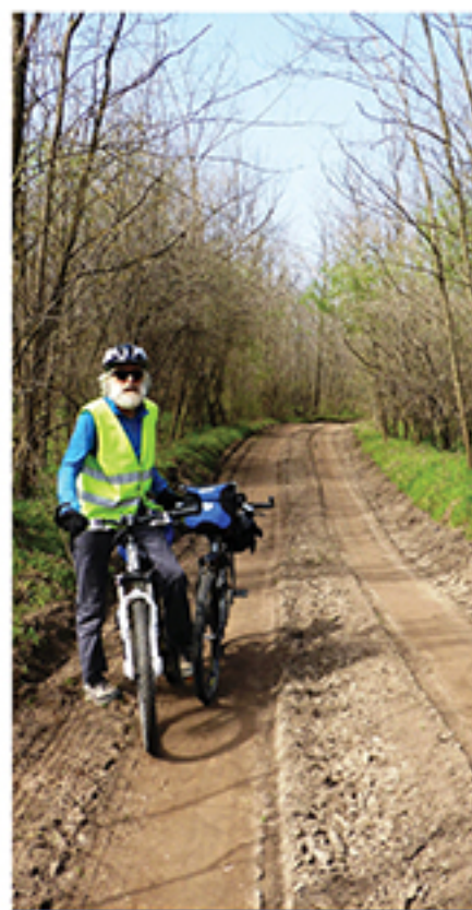
Peščane staze u Deliblatskoj pećari