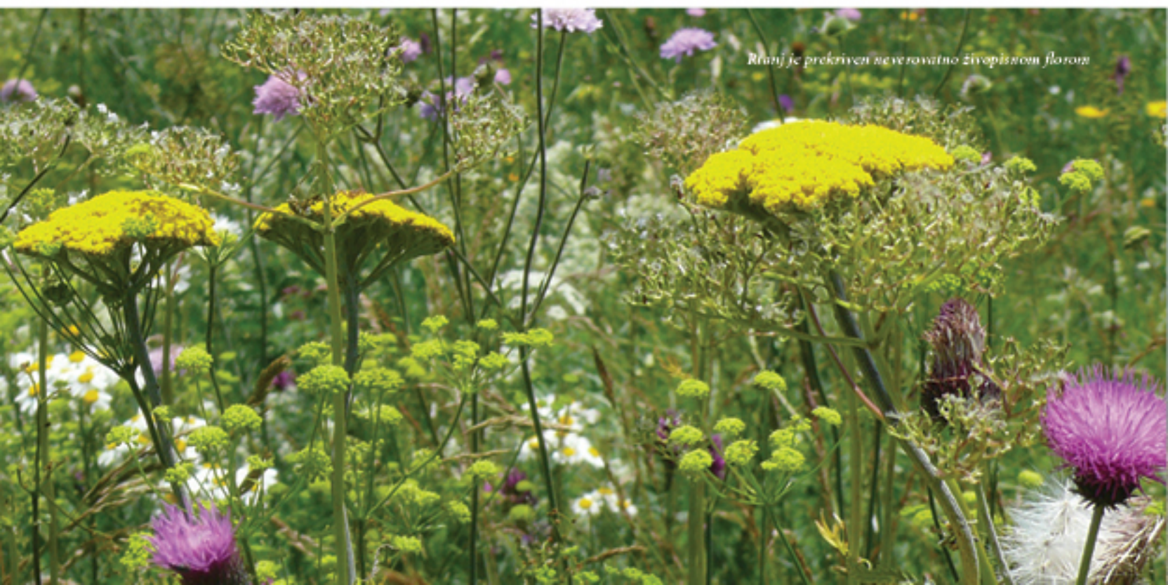
Rtanj je prekriven neverovatno živopisnom florom