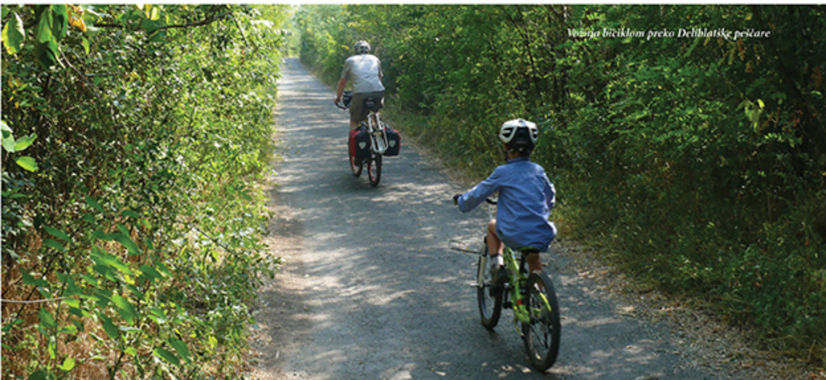
Vožnja biciklom preko Deliblatske peščare

šta skrenite desno na slabo prometan put prema malom selu Šušara (na mađarskom Fejértelepu), koje se nalazi na obodu Deliblatske peščare. Ova deonica rute duga 10km vodi ravno putem kroz široka otvorena polja Banata, preko obronka i potom dole u selo Šušara. Na T-raskrsnici obratite pažnju na vetrenjaču Šušara: istorijski, ovaj mlin je pokretao pumpe za snabdevanje Šušare vodom, omogućavajući upotrebu tekuće vode u selu četiri godine pre nego što su stanovnici Pariza mogli da uživaju u toj prijatnosti, kako tvrde pojedini izvori. Skrenite levo kod vetrenjače i vozite glavnim seoskim putem do drugog kraja naselja prolazeći pored crkve i seoske pro-