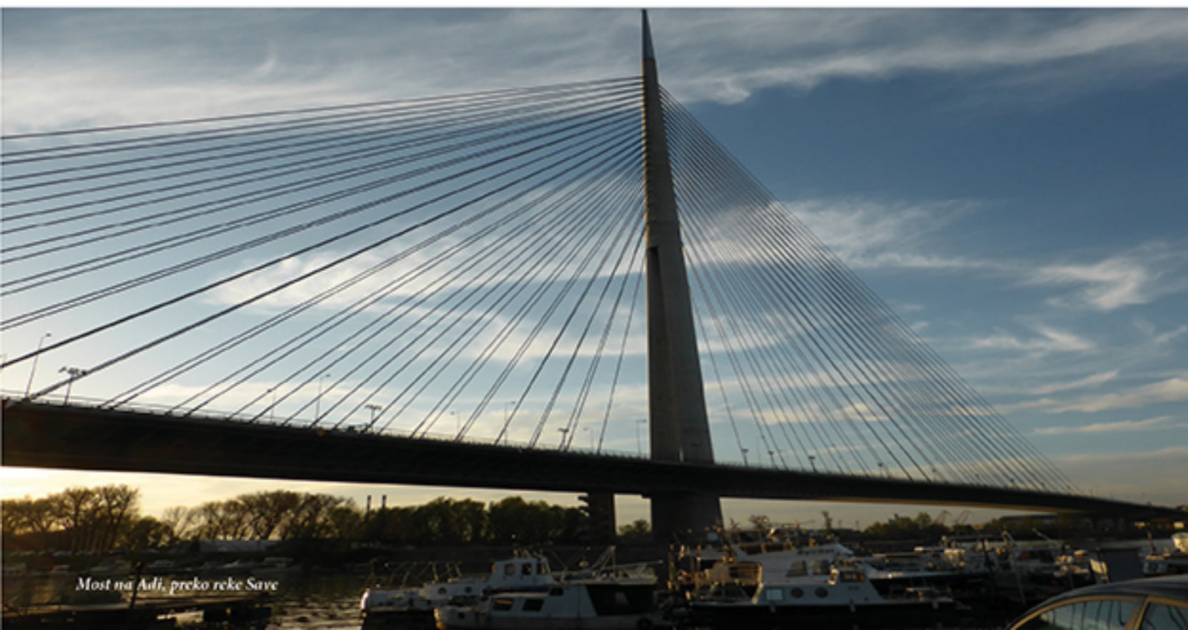
Most na Aidi, preko reke Save