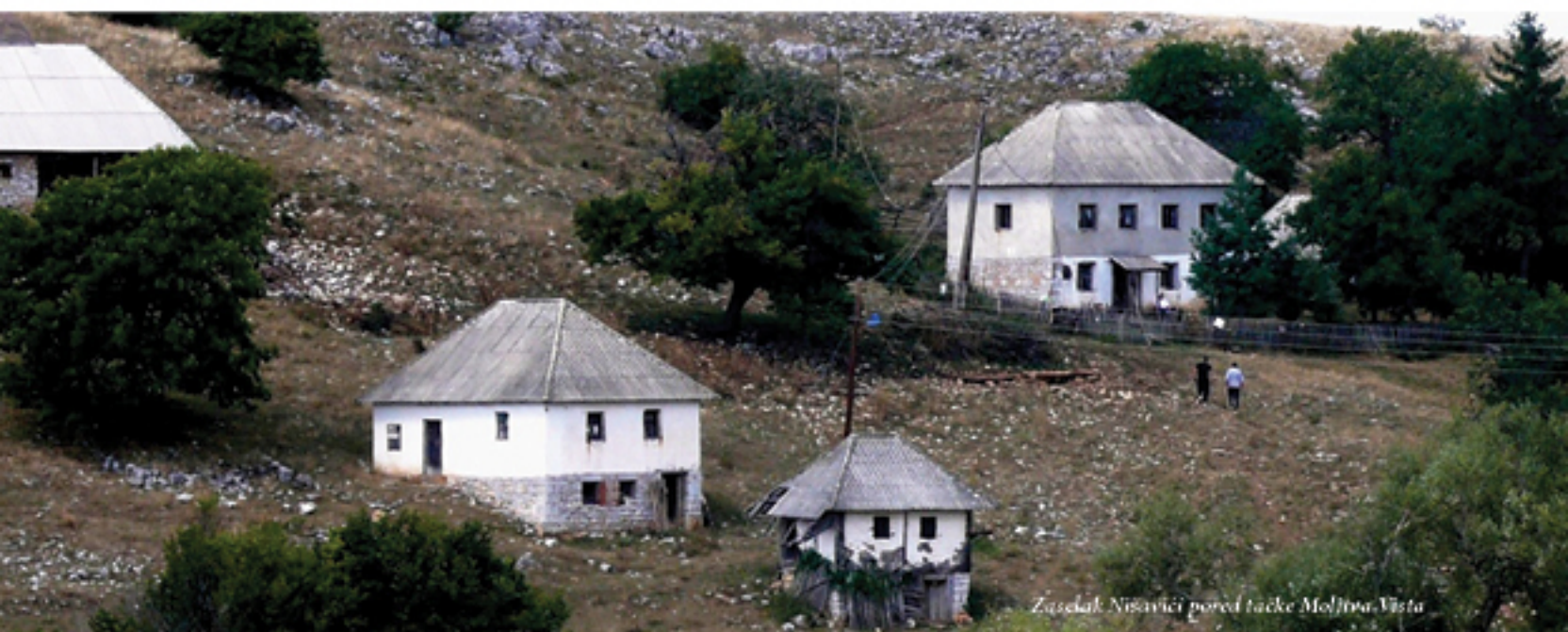
Zaselak Nišavići pored tačke Molirva-Vista