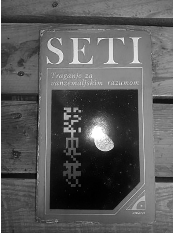
Slika 1.1: Knjiga kao artefakt u više od jednog smisla – Živković (1979) je i dalje najbolji uvod posvećen SETI problematici na srpskom jeziku.

Izdavačka knjižarnica Zorana Stojanovića, najznačajniji izdavač filozofske literature u Srbiji. Pišući predgovor za srpsko izdanje Ulmšnajderove knjige, bio sam iznova suočen sa velikom raznolikošću interdisciplinarnih sadržaja i metoda koji su neophodni za uspešno bavljenje SETI studijama, a za koje ne postoje adekvatni uvodni materijali, za „apsolutne početnike“, kako bi rekao neumrla Dejvid Bouvi. 3 Otuda potiče i jedna vrsta iritacije (ili frustracije) koja je rezultovala pisanjem ove knjige.