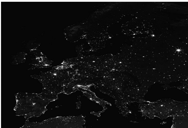
Slika 1.4: Proizvodi ljudske civilizacije vidljivi potencijalno sa međuzvezdanih udaljenosti. (Ljubaznošću Nasine zemaljske opservatorije i Džošue Stivena, te Nasinog centra za svemirske letove Godard.)

koji se pojavljuje u pojedinim studijama jeste kosmička (ili međuzvezdana ) arheologija . 21 U docnijim poglavljima, naročito zaključnom, imaćemo priliku da se upoznamo sa nekim aspektima SETA aktivnosti preduzetih do sada, kao i o mnogo širem rasponu budućih primena.