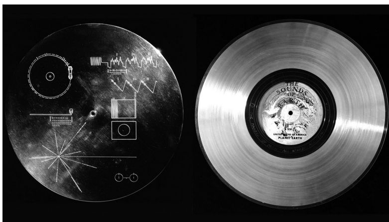
Slika 1.3: Disk sa Vojadžera, prvi zvučni zapis namenjen komunikaciji sa vanzemaljskim razumom.

optimalni. Naravno, taj zaključak bi se mogao promeniti ukoliko bismo negde u našoj blizini, recimo unutar Sunčevog sistema, pronašli sondu vanzemaljskog porekla ili ako bi fizika budućnosti pokazala da je moguća komunikacija brzinom većom od brzine svetlosti u vakuumu.