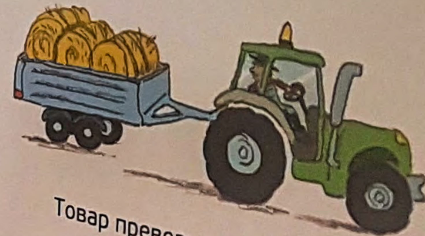
Товар превози у приколици.