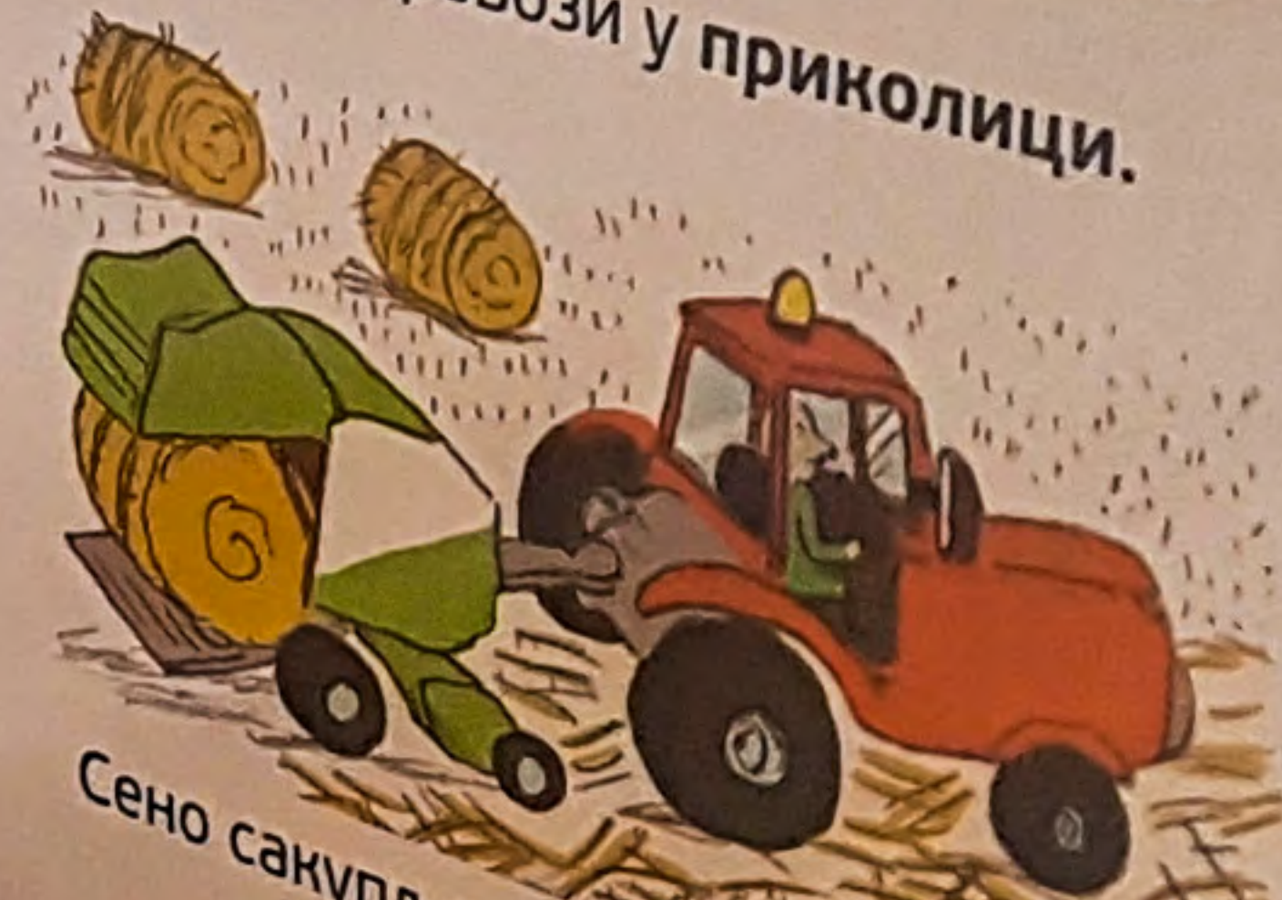
Сено сакупља и балира балирком.