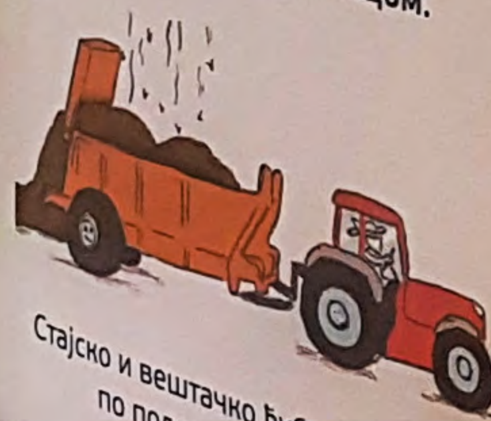
Стајско и вештачко ђубриво расипа по пољима расипачем.