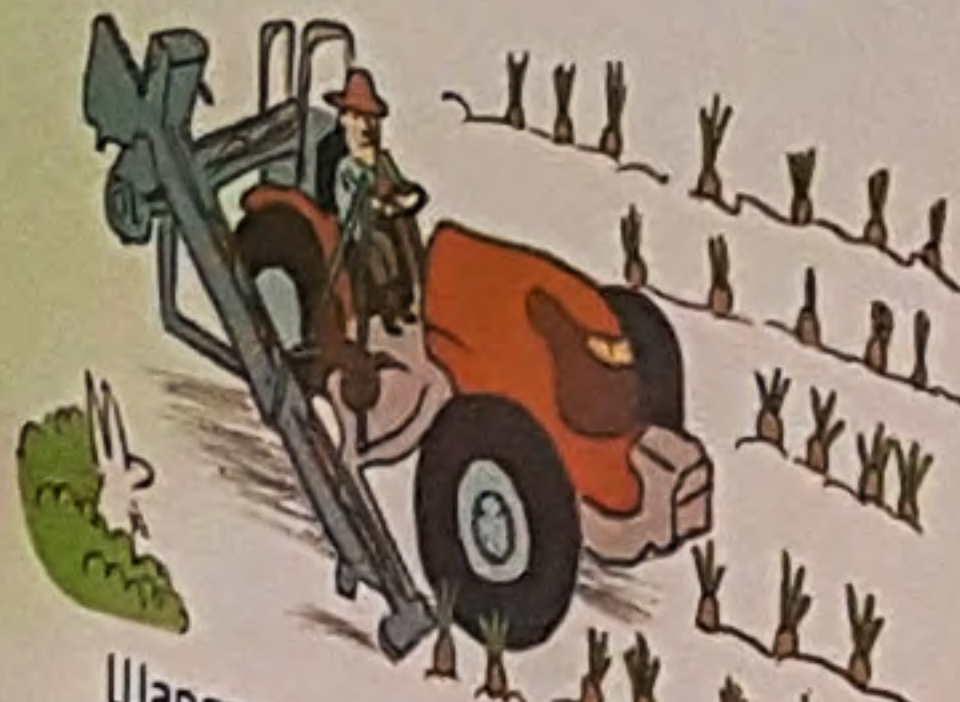
Шаргарепу вади вадилцом.