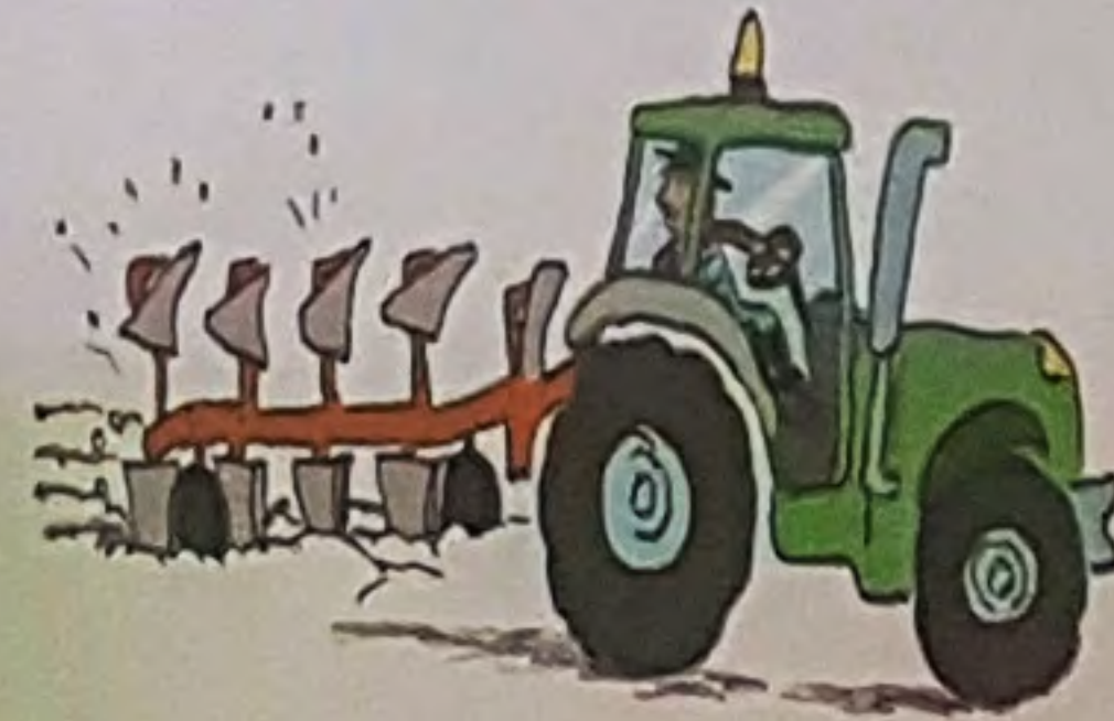
Земљу оре плугом.

Трактор је снажан и вуче велике прикључне машине.