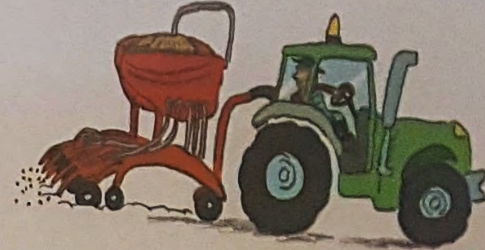
Семе сеје сејалицом.