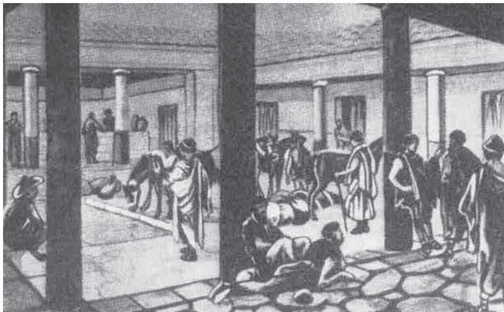
Византијске крчме-кафане назване пандокеоне

пандокеоне 4 у којима се – како истиче – водио буран живот. По Прокопијевом опису, пандокеоне су четвороугаони објекти на спрат, са двориштем у чијем се средишту налазила чесма. Са дворишне стране, а дуж целог објекта, постојали су отворени ходници из којих се улазило у затворене просторије. У дну дворишта, уз напомену да су сви ови објекти грађени на исти начин, налазила се дворана у којој се служило различито пиће и јело за госте – пандокеона.