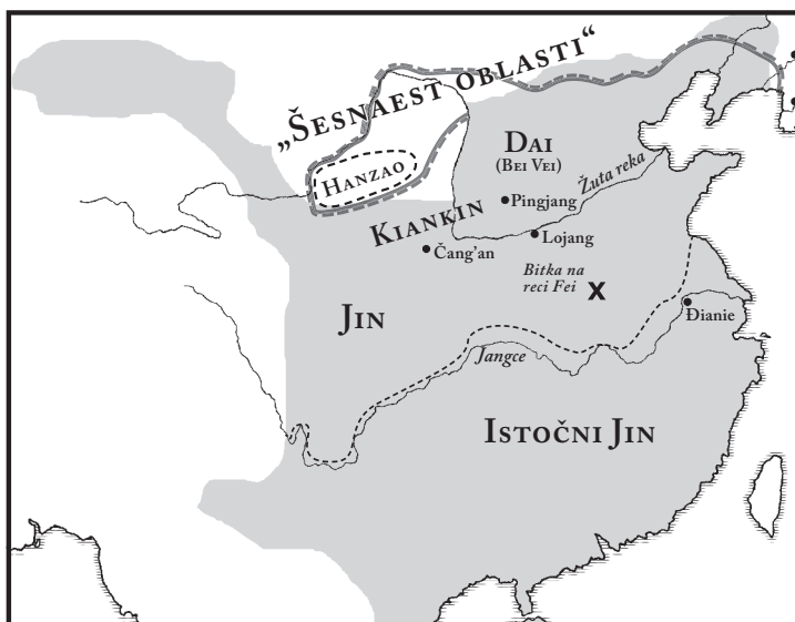
3. Država dinastije Jin

Haotično stanje koje je zahvatilo državu dinastije Jin kasnije je postalo poznato pod nazivom „Pobuna osmorice prinčeva“. Istini za volju, mnogo članova vladarske porodice borilo se za vlast, ali je samo osmorici uspjelo da postanu namesnici poludelom caru, odnosno da dođu do položaja koji im je de facto stavljao carsku krunu u ruke. Usred svih tih nemira car je poživio do 306. godine. Konačno, nepoznati ubica okončao je njegov nesrećni život tako što ga je usmrtio otrovnim slatkišima. 6