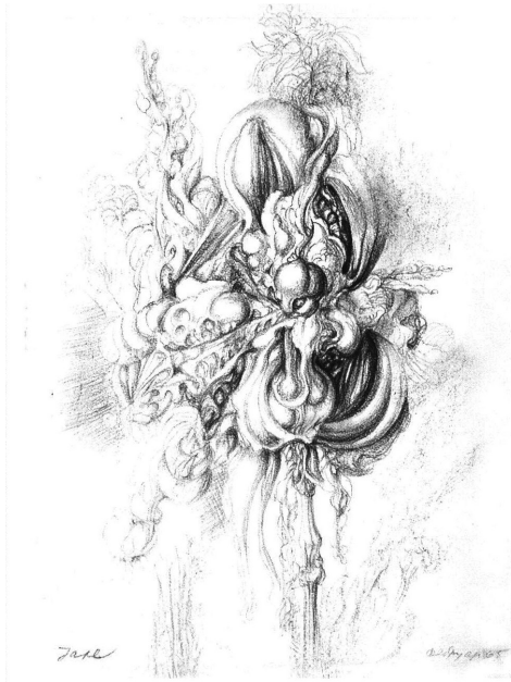
Ljubodrag Janković–Jale, Rascvetavanje , 1965 (crtež)