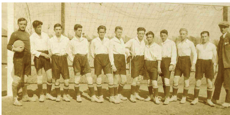
Фудбалски клуб ЈУГОСЛАВИЈА