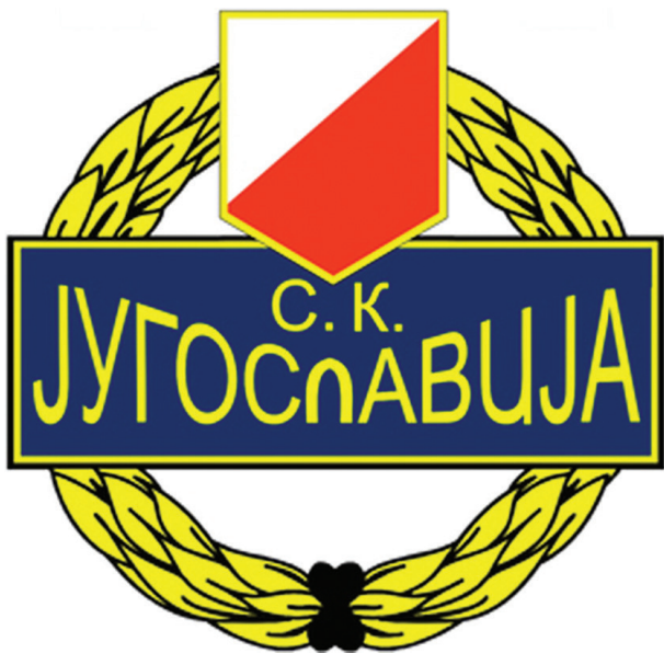
Грб ФК Југославија