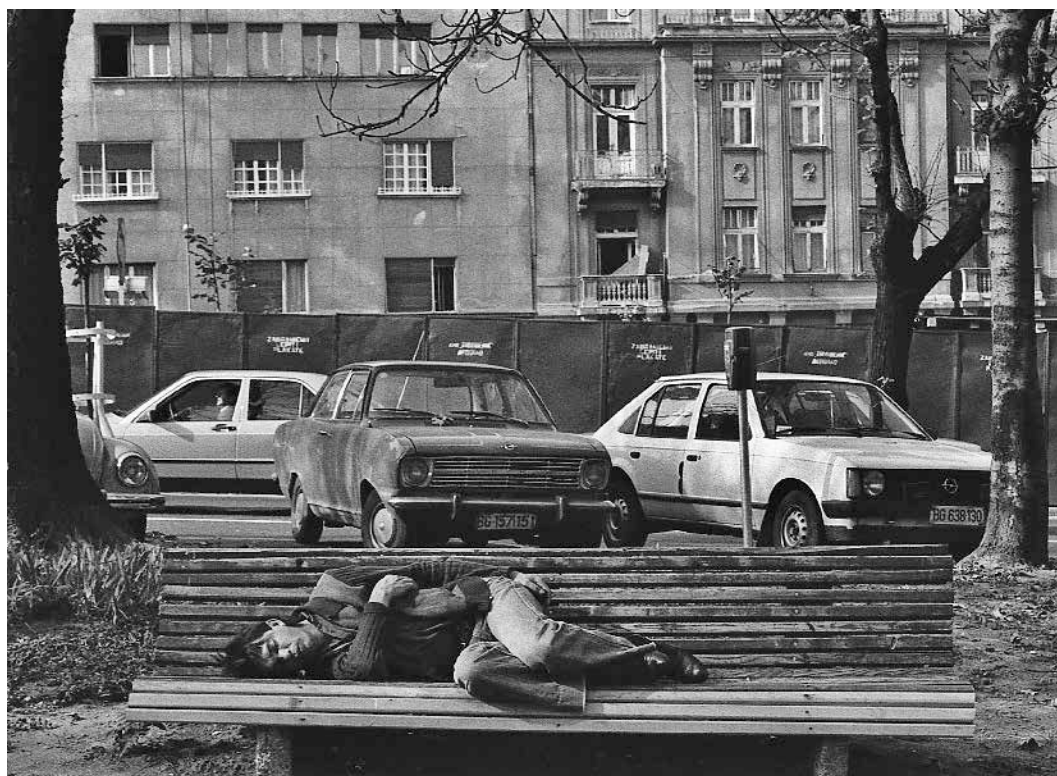
In the small park in front of the Home of the Army, protective fence erected due to the construction of the annex of the National Theater; in the background – buildings on Dositejeva Street, 1987