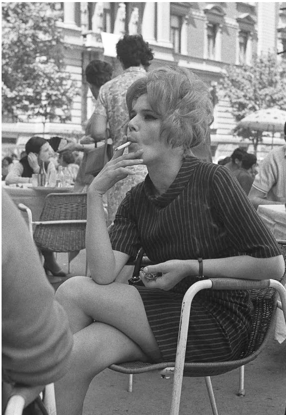
Ћаскање уз цигарету, у башти посластичарнице „Код споменика“, Трг републике, 1967. Chatting over a cigarette, patio of the pastry shop “Kod spomenika” (“By the Monument”), Republic Square, 1967