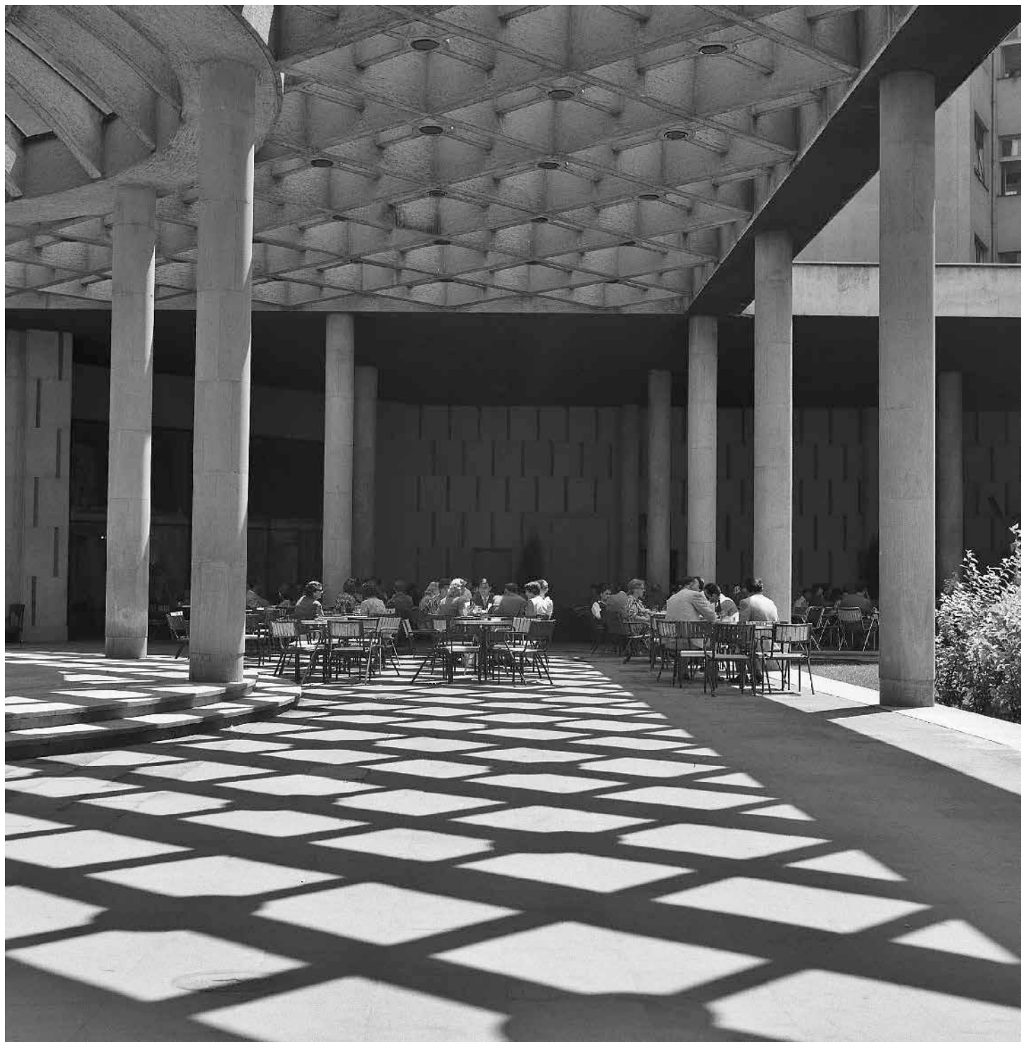
Светлост и сенке, Безистан, 1960. Light and shadows, Bezistan, 1960