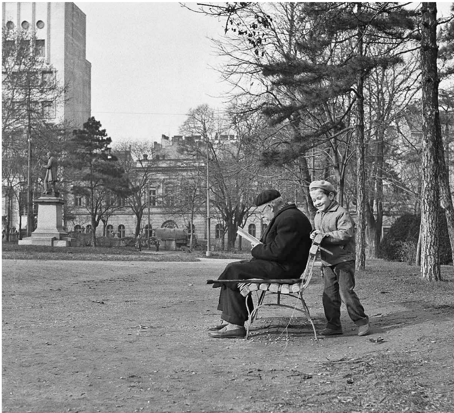
Деда и унук, Студентски парк, 1959. Grandfather and grandson, Students' park, 1959