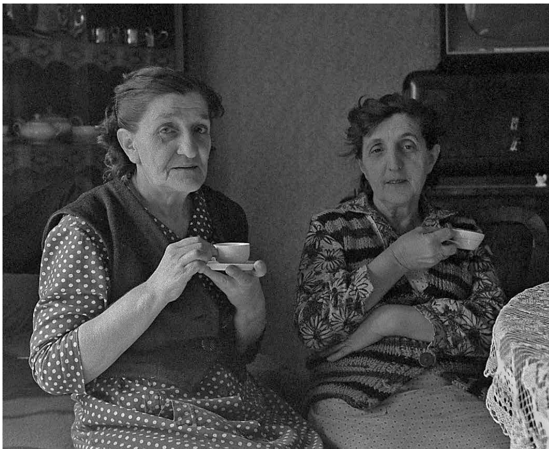
Шољица кафе, Пашино брдо, 1961. A cup of coffee, Pašino brdo (Pasha's Hill), 1961