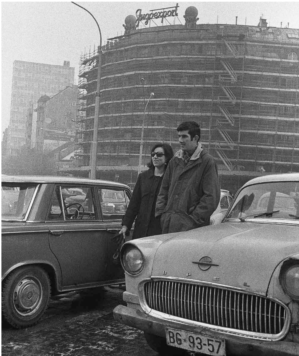
Где смо паркирали?, Трг републике, 1968. Where did we park?, Republic Square, 1968