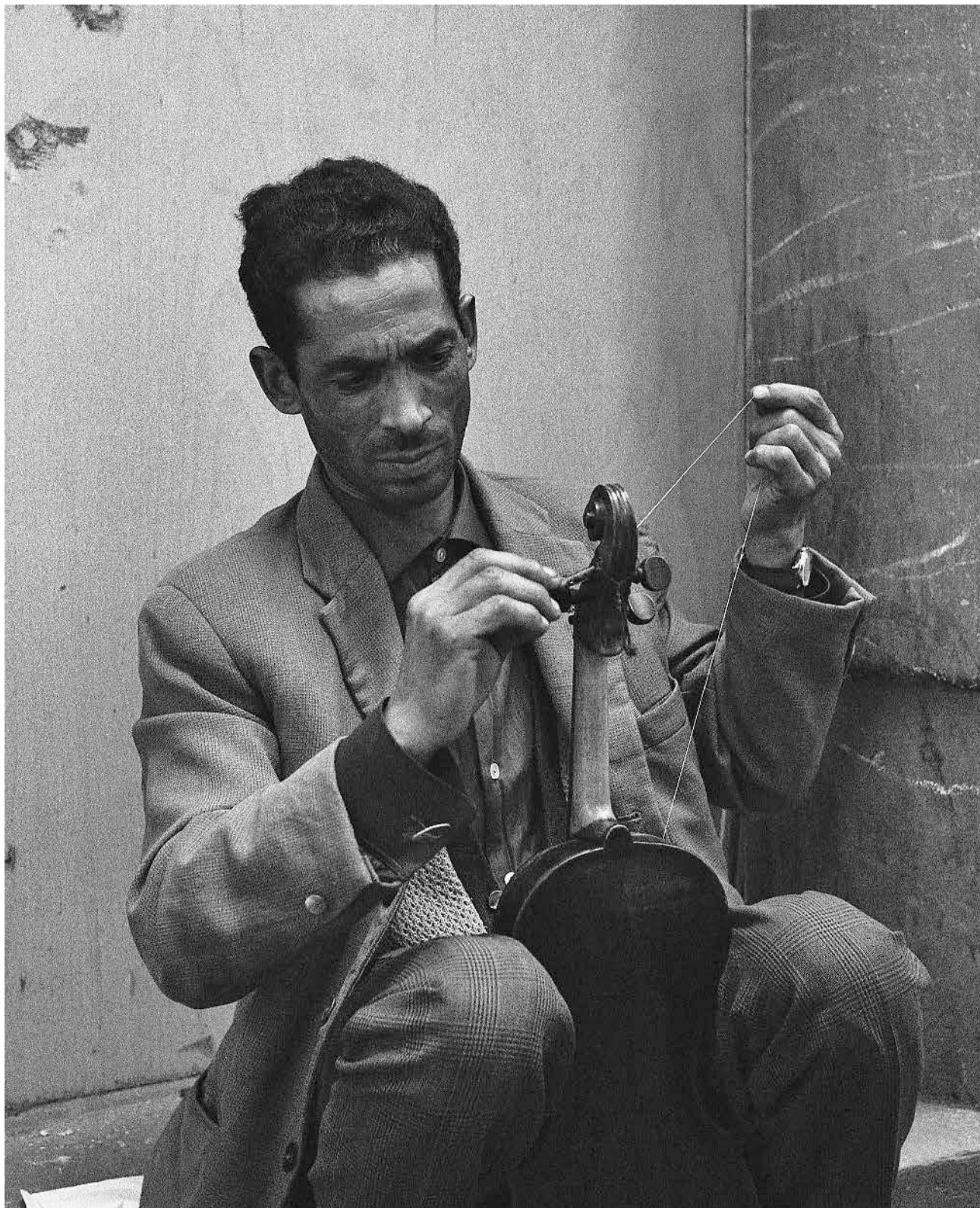
Пукла жица, прекопута Цркве Светог Марка, 1968. A broken string, across the street from St. Mark's Church, 1968