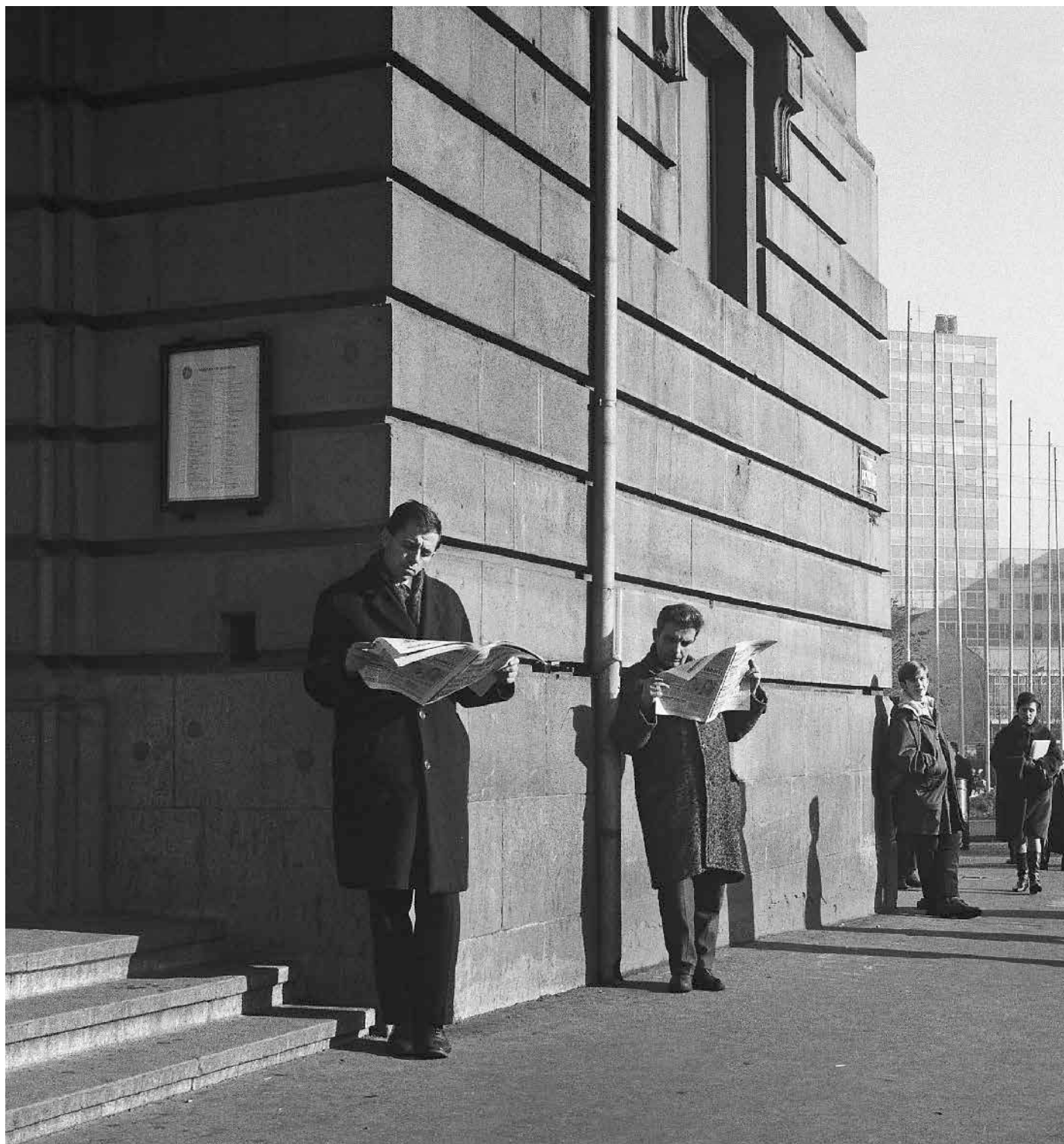
Прелиставање, Народно позориште, Трг републике, 1968. Leafing Through, the National Theater, Republic Square, 1968