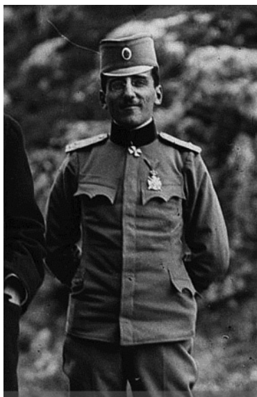
Рејени Александар Карађорђевић