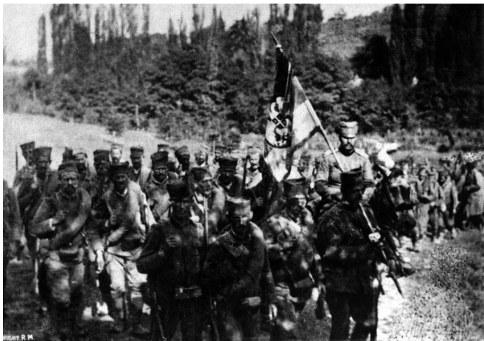
Српска пешадија и српска коњица уочи Церске бијке