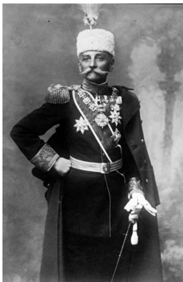
Краљ Петар I Карађорђевић