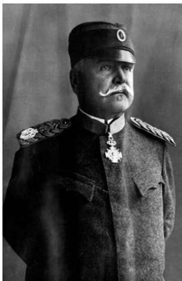
Војвода Степа Степановић