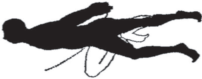
Slika2a. Neprimetno plivanje ninđe