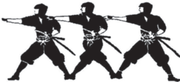
Slika2b. Tehnika bočnog kretanja ninđe