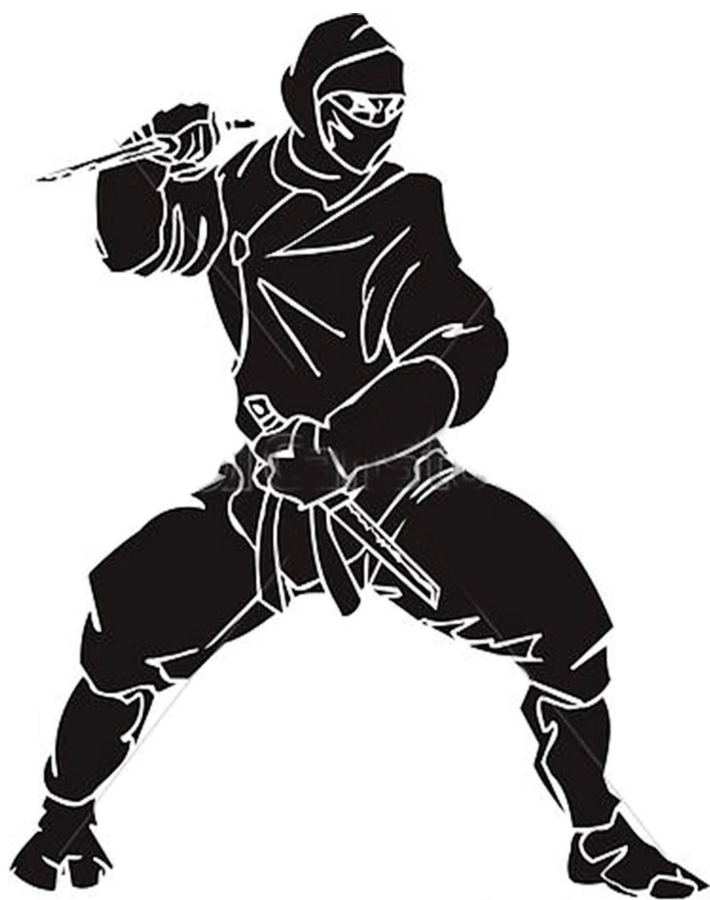
Slika1. Ninda u punoj ratnoj opremi