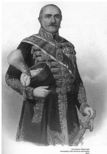
Knez Miloš Obrenović, litografija Anastasa Jovanovića, 1853.

ljudima' da uhvate Živkovića. Dok su ga oni držali, Vučić ga je tukao. Udarao ga je nekom gvozdеноm polugom po levoj strani grudi toliko da je Živković bio skoro 'polumrtav' a onda ga je strpao u zatvor.“