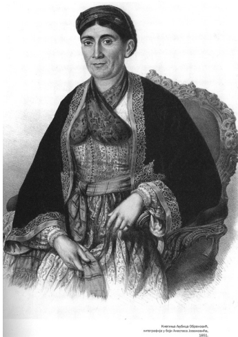
Kneginja Ljubica Obrenović, litografija Anstasa Jovanovića, 1851.

Iako je rođen u vrlo siromašnoj porodici, Miloš je postao najbogatiji čovek Balkana jer je državnu kasu proglasio svojom. „Miloš niti zna šta je od Boga greota, ni od ljudi sramota“, pisao je o njemu Sima Milutinović Sarajlija. Miloš je, međutim, smatrao da je bolje upravljati bez zakona jer „onako se čovek veže za artiju, pa ne može da čini ni zla ni dobra“. Knez je narod ubeđivao da je bolja „sirotinja