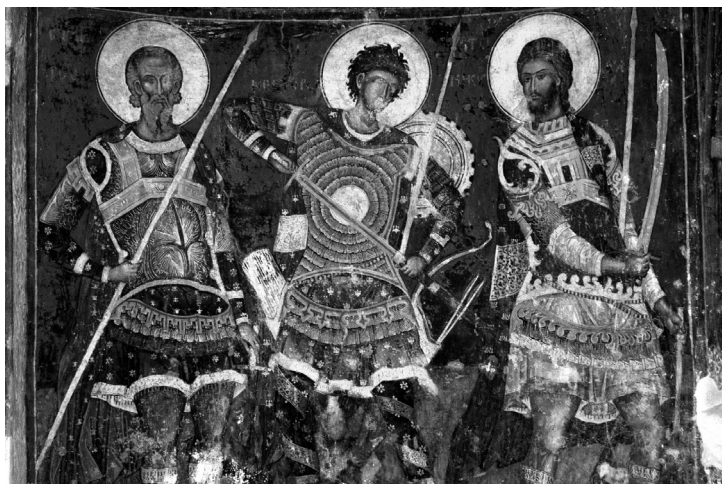
Свети рајиници, фреска из манастира Манасије, XV век

најмоћнији европски ратници, на уласку у Србију остављали су оружје које им је враћано на изласку из Србије. Фридрих Барбароса, који је водио крсташе у поход на Свету земљу крајем XII века, био је гост на двору Стефана Немање у Нишу. Темплари су у то време одлазили и на Свету гору, а у Хиландару се налази и деведесет пет досад уочених темпларских обележја, међу њима и једна икона смештена у маленој капели у централном конаку, наспрам централног храма. Она представља Исуса с три лика на истој икони, што је темпларско обележје у иконосликарству.