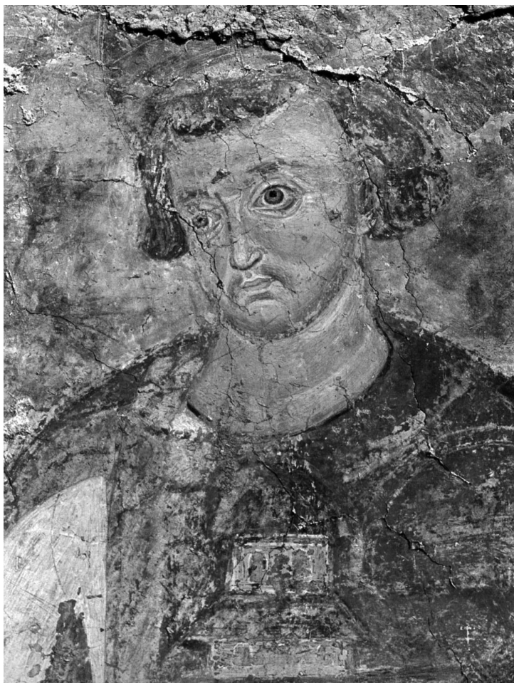
Фреска са ликом краља Стефана Владислава из Милешеве, око 1235. године

круне; три принцезе са три европска двора, из три завађене државе (Византија, Бугарска и Италија) са три стране света (југ, исток, запад) биле су Стефанове венчане супруге и родиле су му три сина – Радослава,