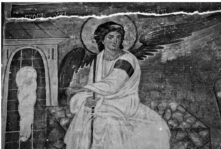
Фреска Белог анђела у манастиру Милешеви

код Пријепоља, на реци Милешевки. Географски, тај предео припада долини реке Лим. Манастир, задужбина краља Владислава, стешњен је између планина Побигоник и Јадовник. Место за градњу манастира није случајно одабрано, јер Лим обалама раздваја а речним током спаја Србију, Црну Гору, Косово и Метохију. Поред историјских података који недвосмислено потврђују како је и зашто изабрана десна обала Милешевке као место градње манастира, постоје и легенде које појаву Белог анђела у долини Лима чине још загонетнијом.