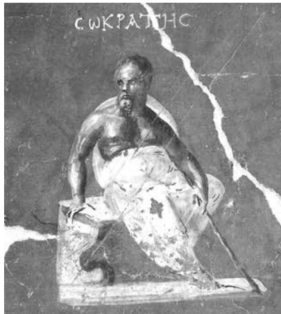
Slika 2. Sokrat, zidna slika, starorimska kuća

Priče o poduhvatima, navikama, susretima i razgovorima antičkih filozofa bili su osnovno obeležje antike i srednjeg veka. Tu je bilo reči o Diogenu koji je Aleksandru rekao da se pomeri; Sekundu, koji se zavetovao na ćutanje, navodno nakon neopisivo gadnog susreta sa svojom majkom; Hiparhiji, koja je mogla da se uda za bilo koga, ali je izabrala muškarca koji je izgledao i živeo kao