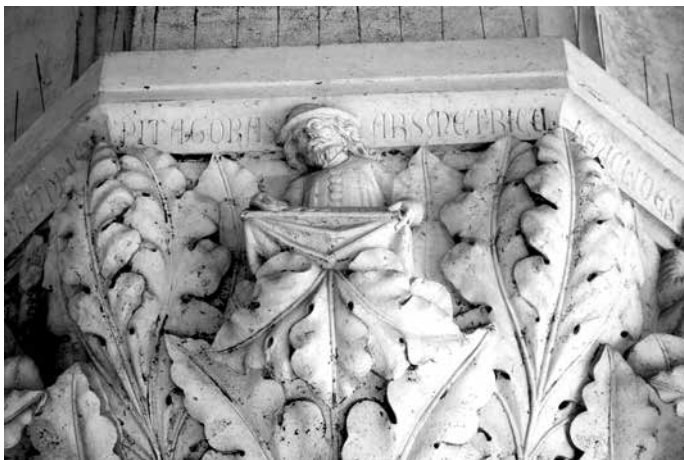
Slika 3. Pitagora kao simbol aritmetike, iz Duždeve palate u Veneciji

Ako danas otputujete na jonsko ostrvo Samos, Pitagorino rodno mesto, ne bi vam palo na pamet da sumnjate u njegovo istorijsko postojanje. Glavni grad zove se Pitagorio. Posetioce na keju pozdravlja inspirativna, geometrijska statua filozofa, matematičara i muzičara iz (navodno) šestog veka p. n. e. Ona oslikava teoremu kojoj je dato Pitagorino ime, a ruka mudraca ispružena je ka gornjem uglu trougla, time sastavljajući sve tri strane. Na bakarnom