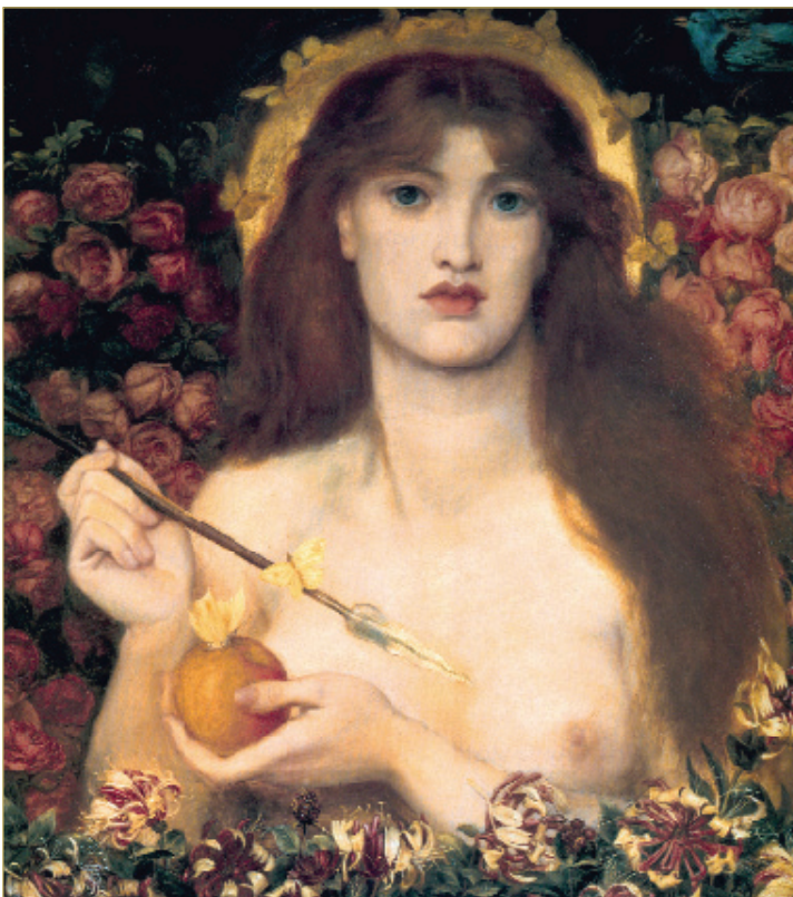
DANTE GABRIJEL ROSETI: Venera Vertikordija

Rimska mitologija je , sa svoje strane, verna replika legendi klasične Grčke : prosto-naprostu su izmenjena imena nekih bogova, kao Hera u Junona, ili Afrodita u Venera. Pripovesti su ostale istovetne. Ipak, postojala su i neka izvorno rimska božanstva, kao Bona Dea (Dobra boginja) ili blizanci Romul i Rem, pored bogova pokorenih naroda, postepeno uvršćenih u rimski panteon.