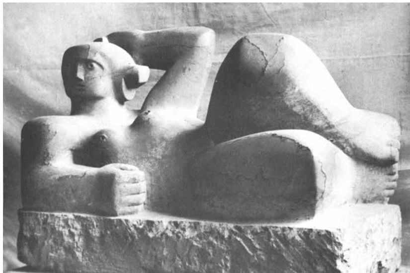
Henri Matisse, Ležec , 1929 (mermer)