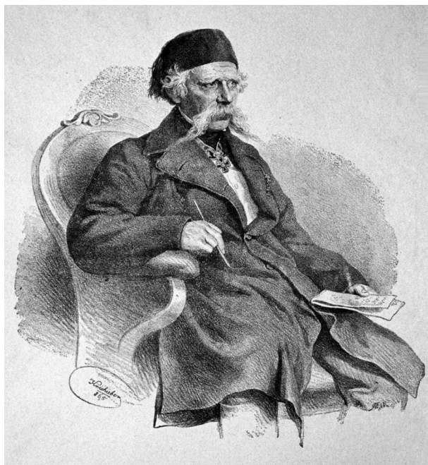
Вук Караџић (1787–1864), литографија Јозефа Крихубера из 1865. године