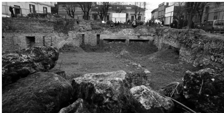
Рушевине Народне библиотеке на Косанчићевом венцу