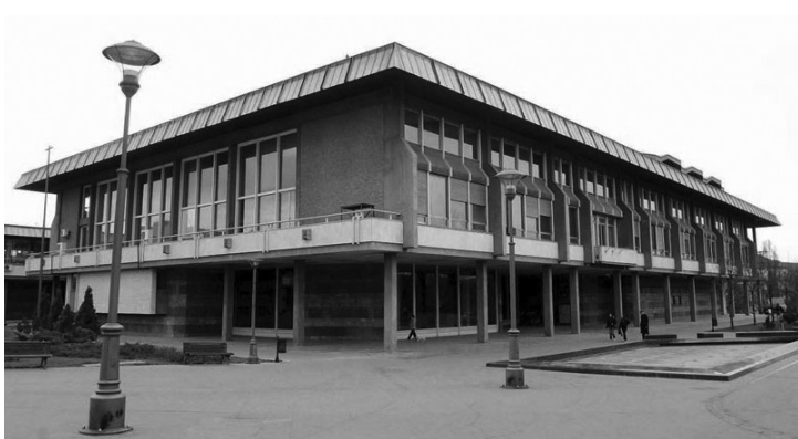
Нова зграда Народне библиотеке Србије у Карађорђевоу парку

да „количина нађеног пепела не одговара количини књига које су се налазиле у библиотеци“. У извештају има још интересантних података о сандуцима у које су биле спаковане књиге, спремне за транспорт у манастир Благовештење. А 3. априла 1941. године долази наредба министра просвете господина Трифуновића да се сандуци спусте у подрум и ту сачекају Немце... Подсећања ради: Народна библиотека је бомбардована у току Првог светског рата 1914. и 1915. године, и у том периоду је три пута била евакуисана. Услед бомбардовања уништен је део књижног фонда, а преостали део је пресељаван на више места у Београду, Нишу, Косовској Митровици, а један део је доспео у Софију!