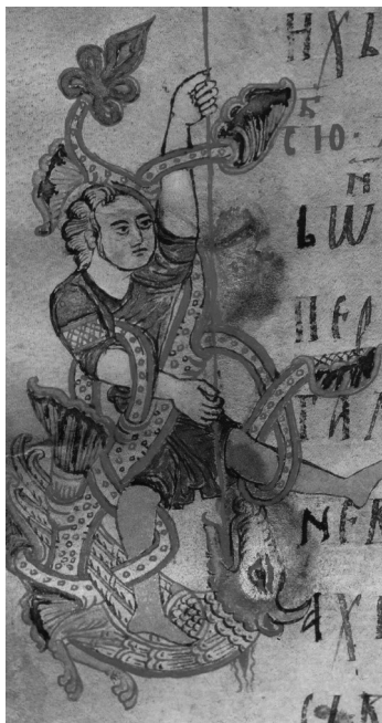
Страница из Мирослављевог јеванђеља

Са архивом Народне библиотеке требало је да крене и Мирослављево јеванђеље , које је после атентата на Александра Обреновића 1903. године – нестало.