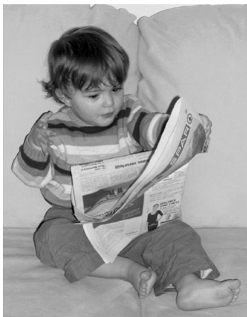
Kakav otac, takav sin

deteta samo ako mu omogućuju da stupa u interakciju s drugom decom i osobama iz bliskog okruženja.