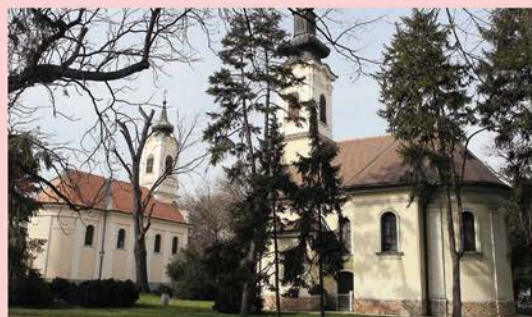
Zemunski park, Crkva Sv. arhangela Gavrila

Dok je u Zemunu čekao na pasoš, nije sedeo skrštenih ruku, pomogao je na svaki moguć način. Koliko je mogao novcem, a pisao je i molio bogate trgovce iz Trsta za pomoć ustanicima, učestvovao u mirovnim pregovorima, kao predstavnik ustanika išao u Bukurešt na sastanak sa ruskim izaslanicima.