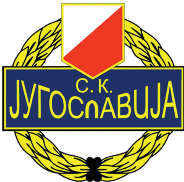
Грб ФК Југославија