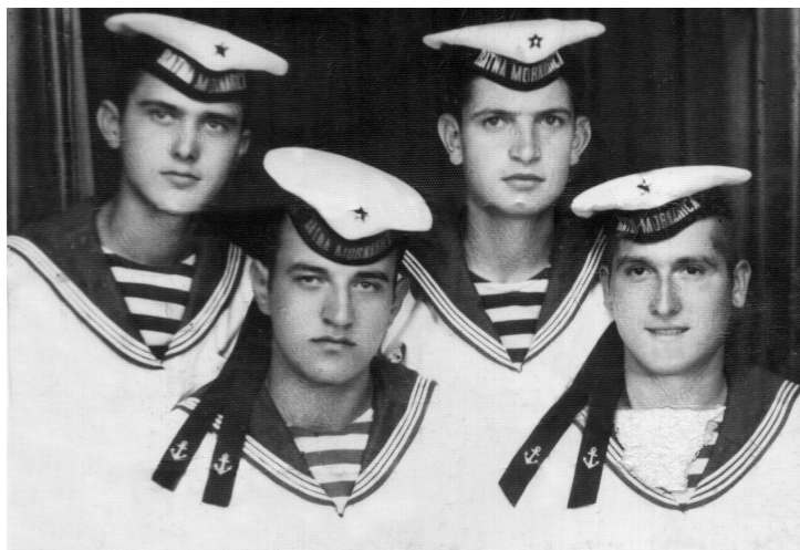
Otac, prvi zdesna

O ovim, ali i mnogim drugim stvarima, nisam pričao ni s kim. Nisam, u to vrijeme, imao mnogo prijatelja kojima bih mogao povjeriti tako ozbiljne stvari. S majkom, opet, nikada nisam uspio razviti odnos koji bih mogao nazvati