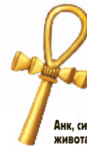
Анк, симбол живота

Прва фараонка била је Хатшепсут, ћерка Тутмоса I, одгајана да га наследи. Била је најмоћнија владарка у историји, моћнија чак и од чувене Клеопатре.