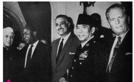
▲ Новину у спољнополитичком ојредељењу Југославије представљала је и политика несвршавања – на конференцији у Београду 1961. године створен је Покрет несвршаних, који су чиниле земље ван два постојећа блока.

До преокрета је дошло 1948. године, након сукоба Тита с Москвом и Јосифом Висарионовичем Стаљином. Од тада, Југославија је била социјалистичка држава с комунистичким уређењем која је велику економску и војну помоћ добијала од Запада, нарочито од Америке. Западу се све више окретала и у сфери културе и свакодневног живота.