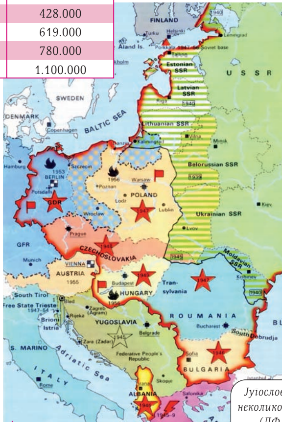
▲ Подељена Европа на карти из Историјског атласа света (Лондон, 1978)

До преокрета је дошло 1948. године, након сукоба Тита с Москвом и Јосифом Висарионовичем Стаљином. Од тада, Југославија је била социјалистичка држава с комунистичким уређењем која је велику економску и војну помоћ добијала од Запада, нарочито од Америке. Западу се све више окретала и у сфери културе и свакодневног живота.