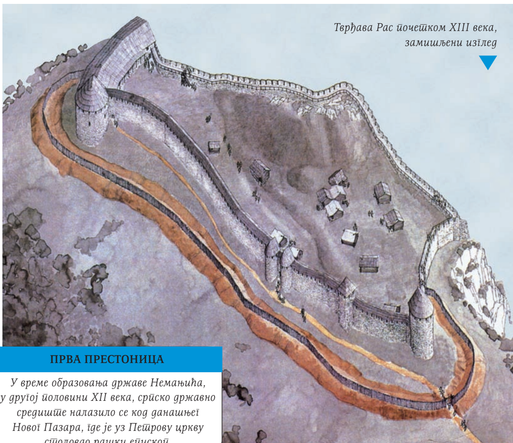
Тврђава Рас почетком XIII века, замишљени изглед

У средњовековној Србији, која дуго није имала праве градове, сâм главни владарски двор је имао значење својног места , то јест престонице. Средиште државе Стефана Немање и његових наследника током готово читавог XIII века није се налазило у граду или у тврђави Рас, већ на више места, у разним дворовима у истоименој области.