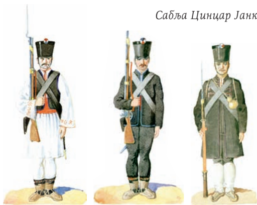
У Тополи се налазио центар за обуку шобџија и војних тирубача

Захваљујући великом труду и помоћи руских официра, Србија је 1808. године добила регулаше – прве униформисане јединице регуларне војске – један батаљон пешадије и једну батерију топова.