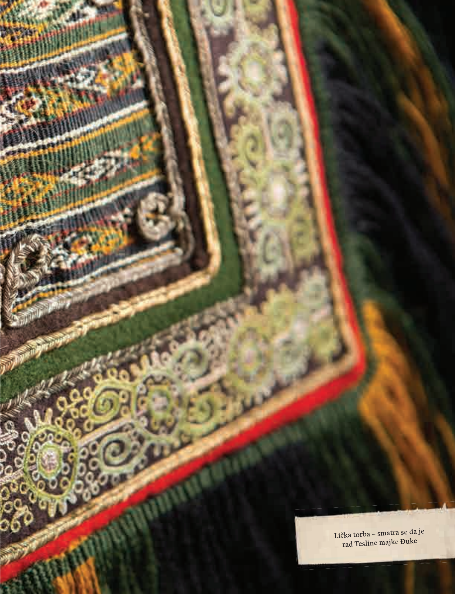
Lička torba – smatra se da je rad Tesline majke Đuke