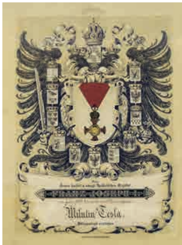
Povelja austrijskog cara Milutinu Tesli

Još za vreme službovanja u Senju istakao se svojim propovedima, pa su ga poneki Senjani poredili sa čuvenim dvorskim propovednikom