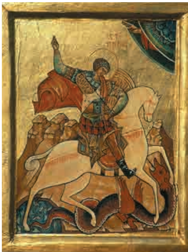
Ikona Svetog Đorđa – zbirka Muzeja Nikole Tesle

i zamišljenim pogledom. O njegovom duhovnom obrazovanju ne znamo mnogo. Sačuvana Milutinova beležnica iz predmeta Pastirsko bogoslovlje može da posluži za dalje proučavanje njegovog bogoslovskeg obrazovanja.