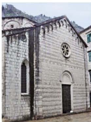
Црква Св. Марије Колеђаше

Главни градски трп налазио се пред катедралном црквом Свештој Трипуна и на њему су се одржавале седнице Великој и Малој већа, заседао је црквени и ојштински суд, окупљеном народу су саопштавани закони и одредбе које је доносила которска ојштина, држане су проповеди.