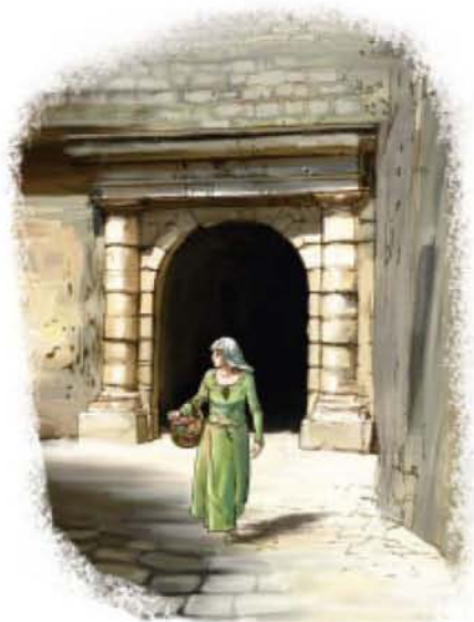
Три Св. Луке на акварелу из XIX века

У град су водиле три капије: са мора (главна), са реке Шкурде и са извора Гурдић. Кроз њих се улазило у систем уских кривудавих уличица. У средњем веку главна улица у Котору – via publica – пресекала је град по ширини и повезивала јужну градску капију са северном. Сви трговачки послови које је Котор имао са залеђем били су везани за ову улицу, јер су кроз капије свакодневно пристизали путници и трговачка роба.