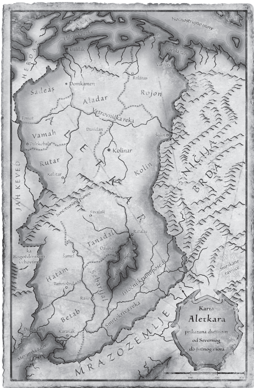
Karta Aletkara i okolnih krajeva, koju su iscrtili kraljevski izvidnici njegovog veličanstva Gavilara Kolina, oko 1167.