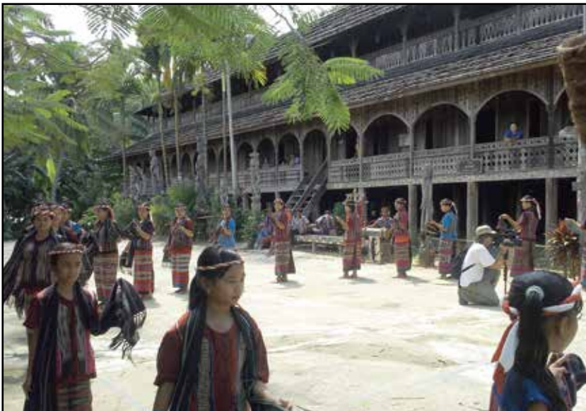
Kalimantan, dugačka kuća i folklor u dajačkom selu