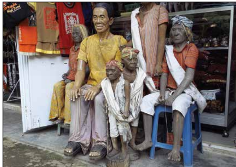
Sulavezi, Tana Toraja – tau-tau lutke