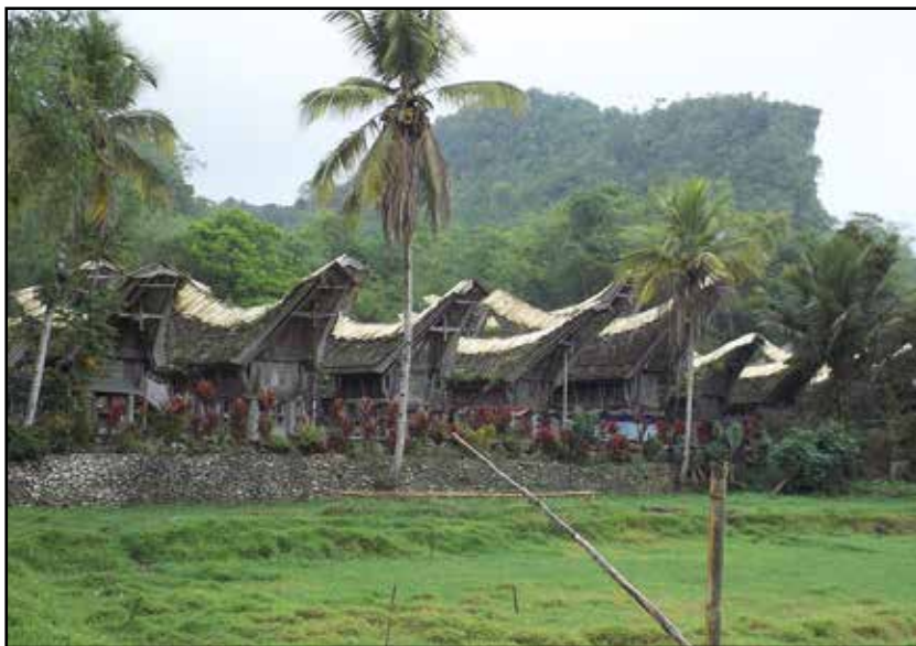
Sulavezi, selo Kete Kesu i tipična Toraja arhitektura