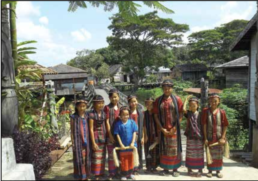
Kalimantan, odbor za doček u dajačkom selu