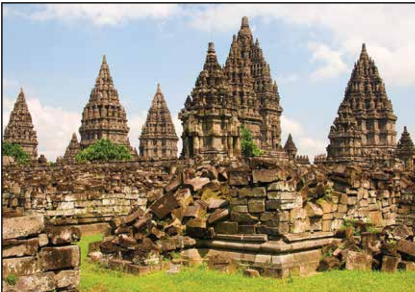
Java, Džogdžakarta – hram Prambanan