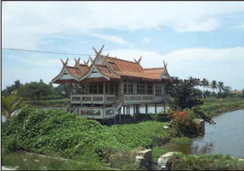
Sulavezi, kuća Bugisa