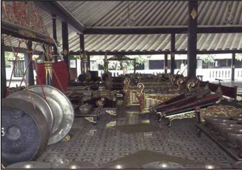
Java, Džogdžakarta – gamelang muzički instrumenti u palati Kraton