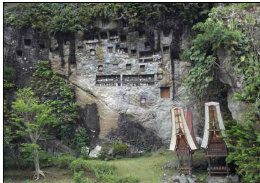
Sulavezi, Tana Toraja – grobovi u liticama i tau-tau lutke