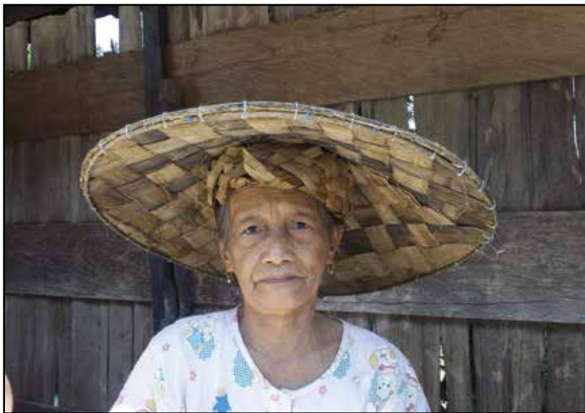
Kalimantan, žiteljka dajačkog sela