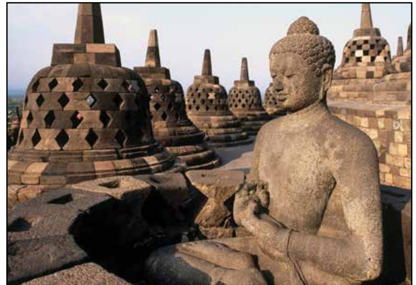
Java, Buda u hramu Borobudur