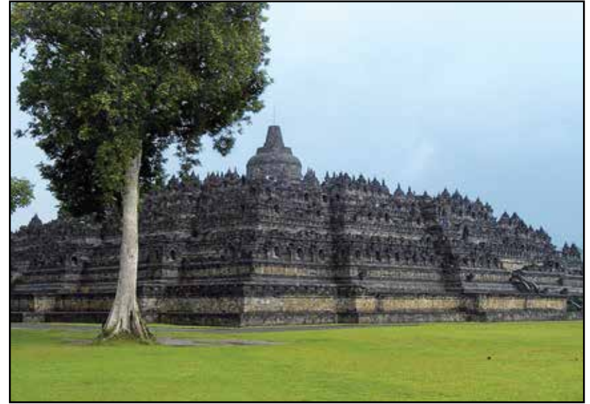
Java, veličanstveni hram Borobudur