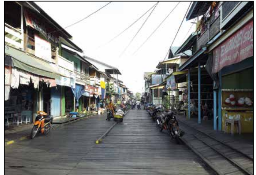
Kalimantan, selo Muara Muntai