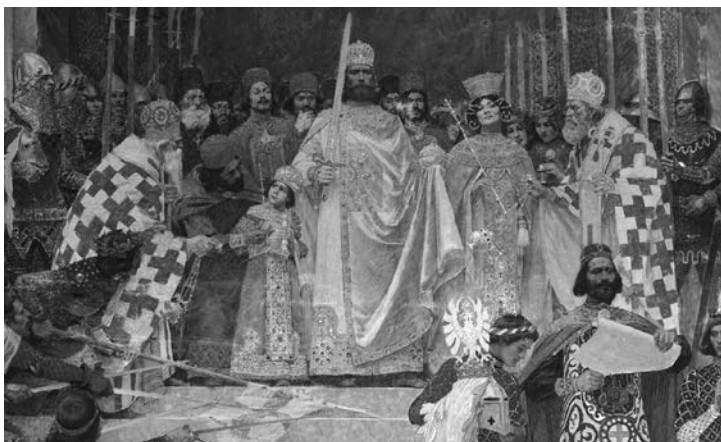
ПАЈА ЈОВАНОВИЋ, Крунисање цара Душана , Народни музеј у Београду

У предвечерје великих војних похода, који тек што нису отпочели, браћа Мрњавчевићи припадали су оној групи Душанове властеле која није носила звучне титуле, али је представљала ударну снагу његових ратних подухвата. Оно што их је ипак издвајало од другог нижег племства било је то што су стекли поверење неких од најмоћнијих људи на краљевом двору.