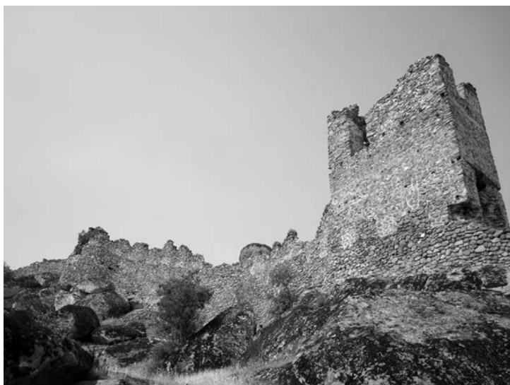
Зидине средњовековног Прилепа

Марков живот започео је у доба када је Србија крупним корацима ширила своје границе и видике. У време његовог рођења млади краљ Душан је управо учврстио власт и спремао се за велика освајања, а породица Мрњавчевић је спадала међу властелу која је била