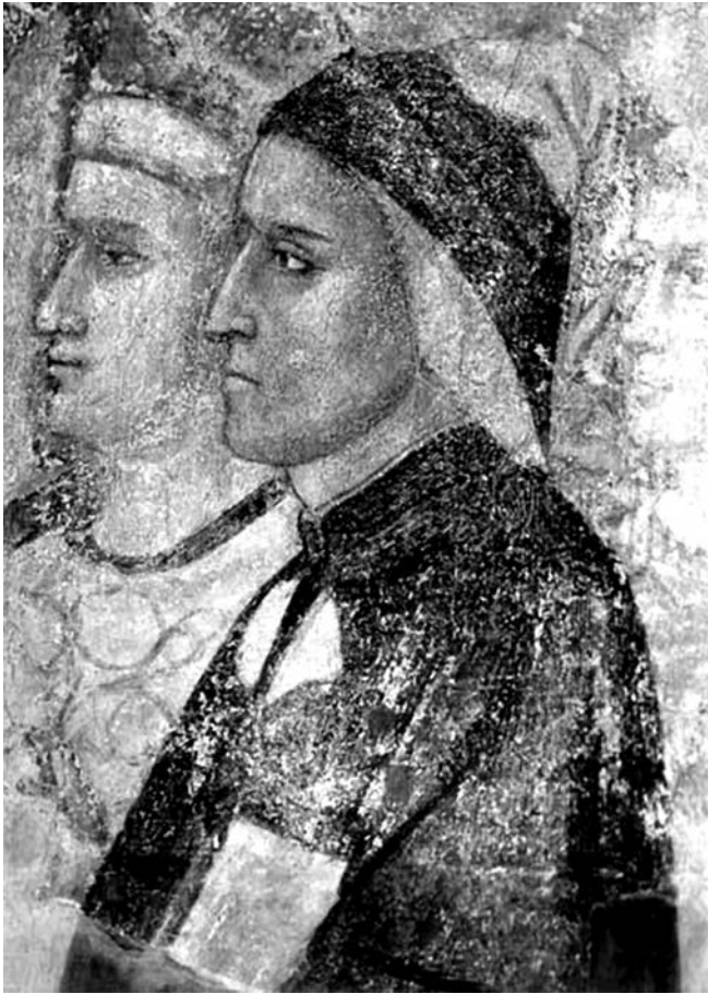
ПОРТРЕТ ДАНТЕА АЛИГИЈЕРИЈА

друштва. Док је у архитектури готика доживљавала свој процват, у Италији и другде почели су да се јављају и први весници једног сасвим новог духа. Почетком 14. века Дантеова Божанствена комедија најавила је важне промене, али ће проћи још доста времена до периода када ће личности попут песника Петрарке, књижевника