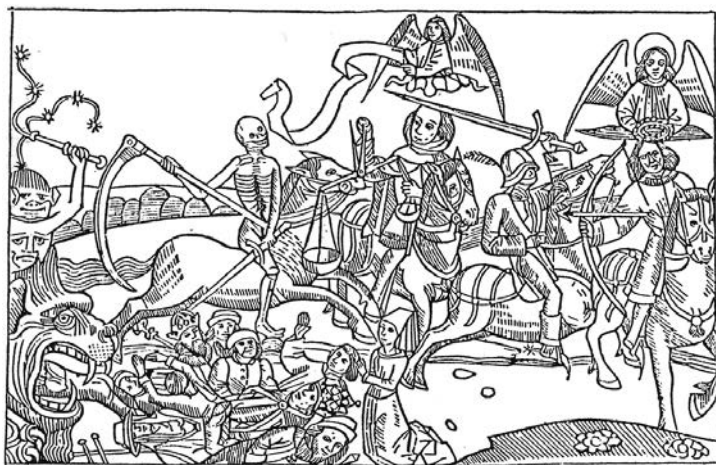
ЧЕТИРИ ЈАХАЧА АПОКАЛИПСЕ

рата. Сукоб који је избио 1337. године између Енглеске и Француске убрзо је захватио њихове суседе, а одразио се и на привреду целог континента. Права катастрофа наступила је када је енглески краљ Едвард III прогласио банкрот, што је 1345. године довело до пропасти две највеће европске банке Барди и Перуци , у Фиренци.