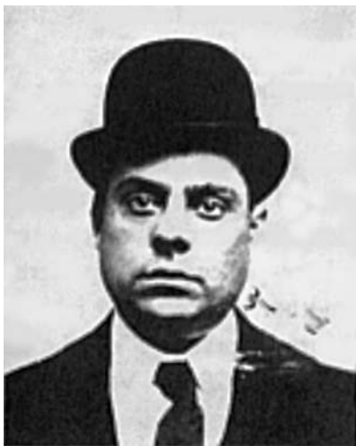
Injacio „Lupo Vuk“ Sajeta

je stajao iza tezge. Niko nije optužen za ovaj zločin, iako je generalno bilo poznato da su ubice radile za poznatog zlikovca Lupo Vuka, kriminalca čiji je štab bio u italijanskom delu Harlema. Lupo se šepurio Harlemom pokazujući preplašenim zemljacima da mu zakon ništa ne može.