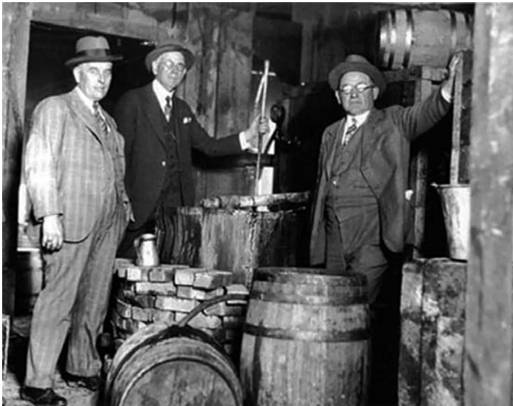
PROHIBICIJA: Izvor prihoda koji se nije mogao zaobići

nisu dovoljno dugo živeli da to shvate. Novi „bosovi“ nisu dozvoljavali da im neko uznemirava proizvođače, i vrlo brzo je klasični reket bespomoćnih malih biznismena prestao da postoji. Crna ruka više nikog nije plašila, a reket će se ponovo pojaviti pedesetih godina, ali u krajnje rafiniranoj varijanti.