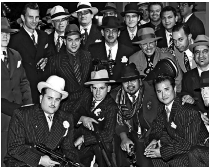
KRIMINAL KAO NAČIN ŽIVOTA: „Vojnici“, „poručnici“ i „kapetani“

tumačenja i primene nema nikakve dileme. Nema opravdanja za greške, potkradanje porodice, „poslove sa strane“ za koje porodica ne zna, ugrožavanje sigurnosti porodice na bilo koji način, da ne govorimo o saradnji sa zakonom. Kazna je uvek smrt, sprovodi se iznenada tako da grešnik nema šanse da se izvuče i to služi kao primer ostalima, uz jasan stav da je reč o „nečasnoj“ delatnosti člana koji je uprljao ne samo svoj obraz već i ugled cele porodice.