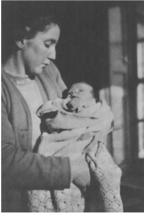
U majčinom naručju

Moja majka rodila se u Danfermlinu u Škotskoj, kao treće od osmoro dece porodičnog lekara. Najstarije je bila devojčica s Daunovim sindromom. Do smrti u trinaestoj godini, živela je odvojeno s negovateljicom. Preselili su se na jug, u Devon, kad je majka napunila dvanaest godina. Njena porodica, baš kao i očeva, nije bila imućna. Ipak, uspeali su da pošalju majku na Oksford. Posle studija je radila svakojake poslove. Bila je i poreski