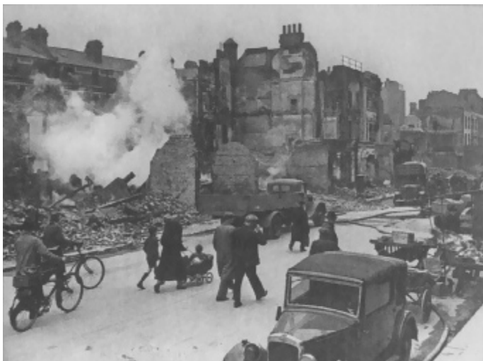
London za vreme Blickriga

železničke pruge na Krauč Endu, pored Hajgejta. Sanjao sam električne voziće. Iskoristio sam odsustvo roditelja i povukao skromnu ušteđevinu iz poštanske štedionice, uglavnom novac koji sam dobijao u specijalnim prilikama, poput krštenja. Potrošio sam je na kupovinu električnog voza. Ni on nije radio kako treba. Silno sam se razočarao. Trebalo je da ga vratim u radnju i da zatražim da ga prodavac ili proizvođač zamene. U ta davna vremena kupovina bilo čega smatrana je privilegijom. Ako bi se ispostavilo da proizvodu nešto fali, jednostavno biste pomislili da niste imali sreće. Platilo sam popravku električnog motora. Ni posle toga nije dobro radio.