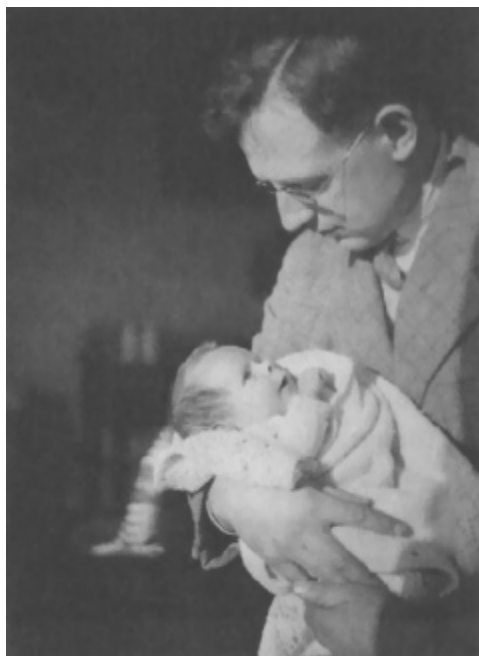
Otac i ja

Otac je dobio niz školarina i nagrada, koje su mu omogućile da vrati novac roditeljima. Nakon studija se posvetio istraživanjima tropske medicine. Godine 1937, otputovao je u istočnu Afriku radi istraživanja. Kad je rat počeo, proputovao je Afriku kopnenim putem i spustio se niz reku Kongo da bi našao brod za Englesku. Dobrovoljno se prijavio u vojsku kad se vratio u domovinu. Rečeno mu je da će biti mnogo korisniji na polju medicinskih istraživanja.