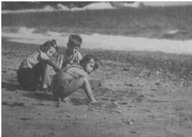
Sestre i ja na plaži

se zato što sam prvi put ostavljen s nepoznatim ljudima. Mislim da sam iznenadio roditelje svojom reakcijom, zato što sam im bio prvo dete i zato što su verovali knjigama o dečjem razvoju, u kojima je pisalo da bi deca od dve godine trebalo da budu spremna za samostalno uspostavljanje društvenih veza. Odveli su me iz jaslica nakon tog groznog jutra. Godinu i po dana me nisu slali natrag.