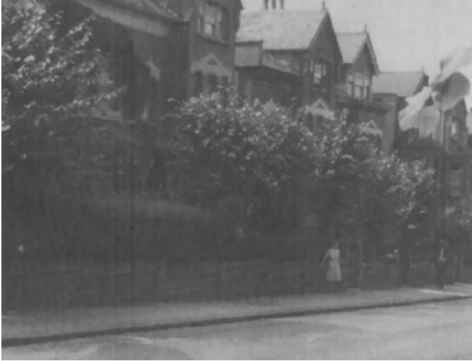
Naša ulica u Hajgejtu, London