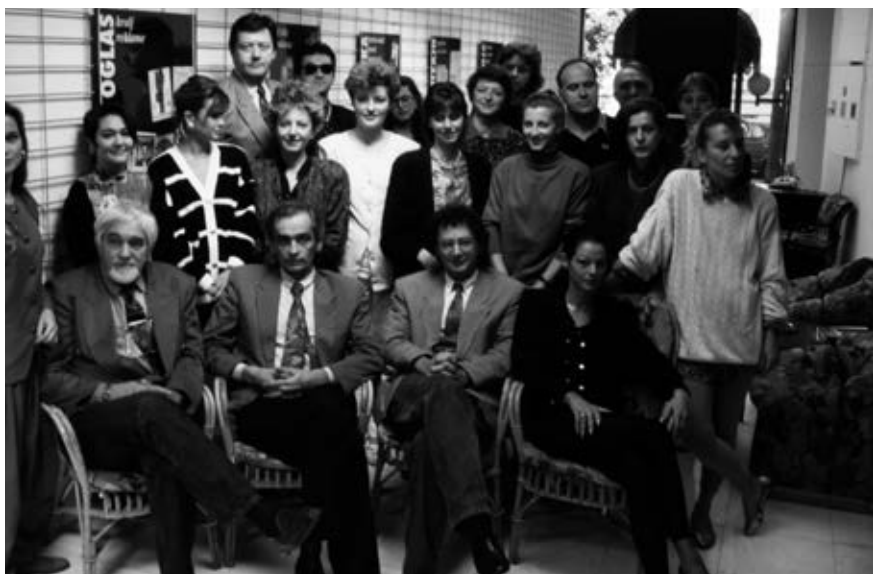
SM Saatchi & Saatchi, Beograd, 1991. godine