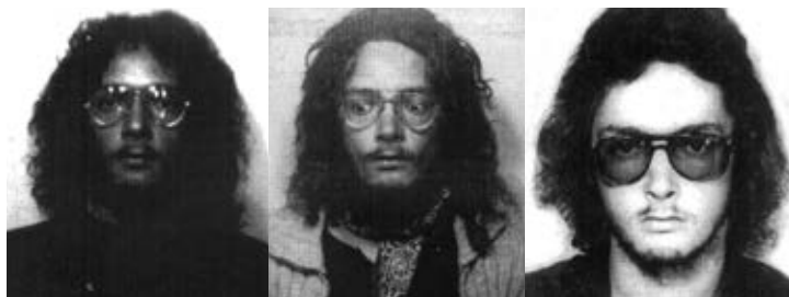
Metamorfoze jednog studenta, 1973–76. godina

Negde sam morao da se upišem da me ne bi pozvali u vojsku, a nisam znao gde. Moj sledeći izbor bila je psihologija, ali su i