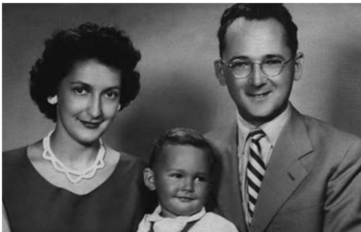
Moj početak je bio lep, sa roditeljima 1956. godine

dešavalo – muzika, moda, trendovi... I, naravno – devojke i slobodan način života. Šta se više u tim godinama može poželeti?!