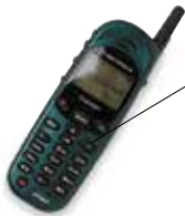
le portable mobilni telefon