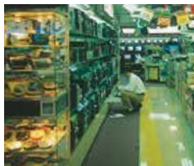
l'électroménager električni aparati