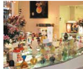
la parfumerie parfimerija