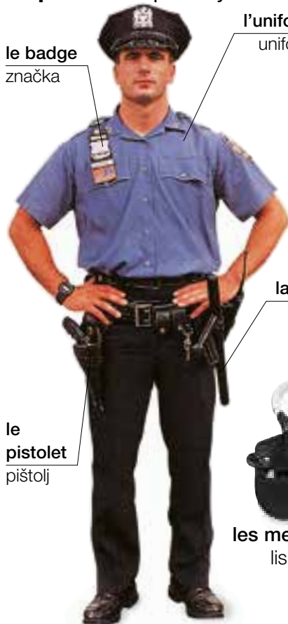
le badge značka