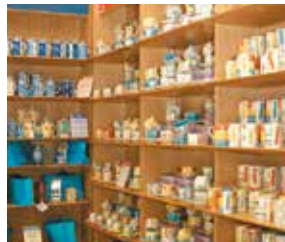
la porcelaine porcelan