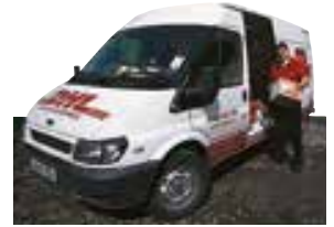
le service de messagerie kurir