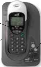
le téléphone sans fil bežični telefon