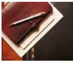
la papeterie pisaći pribor