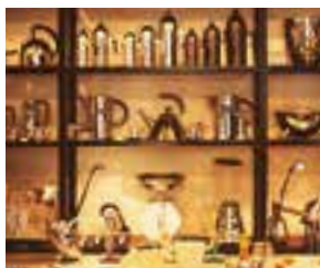
la vaisselle kuhinjski pribor