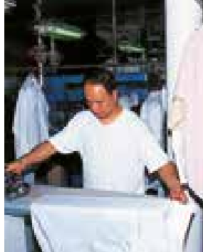
le service de blanchisserie pranje veša