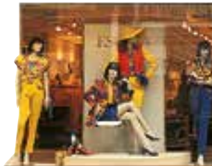
les vêtements pour femme ženska odeća