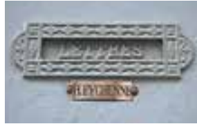
la boîte aux lettres poštansko sanduče