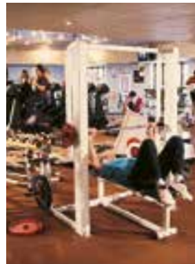
la salle de sport teretana