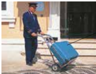
le porteur portir