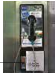
le téléphone à pièces telefon na kovani novac