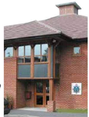
le poste de police policajska stanica