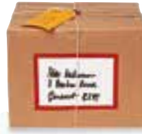
le colis pošiljka