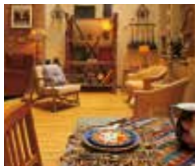
l'ameublement opremanje kuće