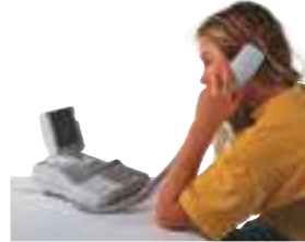
le visiophone video-telefon