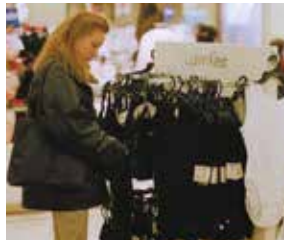
la lingerie donji veš