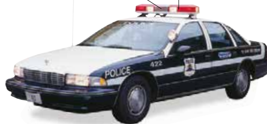
la voiture de police policijski automobil