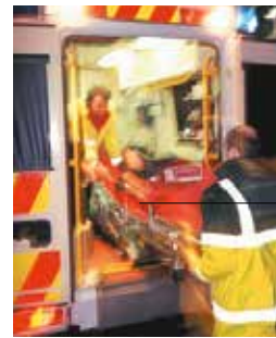
le brancard nosila