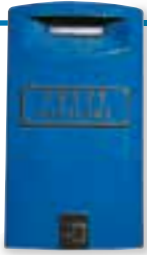
la boîte aux lettres poštansko sanduče