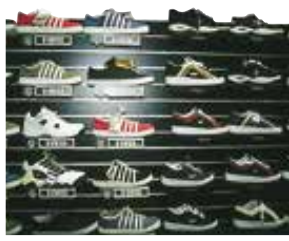
les articles de sport sportska oprema