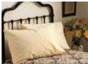
la chambre simple jednokrevetna soba