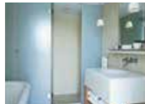
la salle de bain privée kupaćilo u sobi