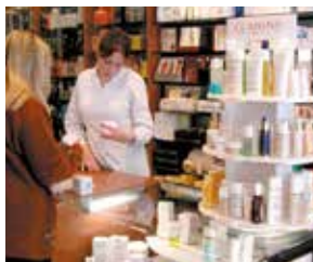
la beauté kozmetika