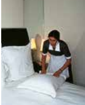
le service de ménage čišćenje sobe