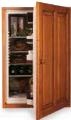
le minibar mini-bar