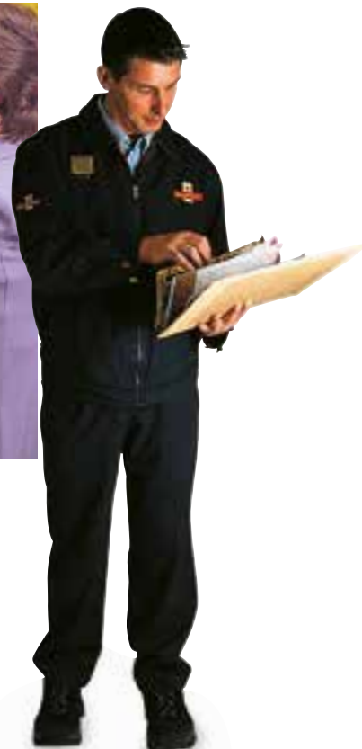
le facteur poštar