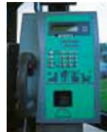
le téléphone à carte telefon na karticu