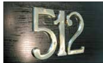
le numéro de chambre broj sobe