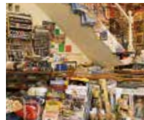
la mercerie galanterija