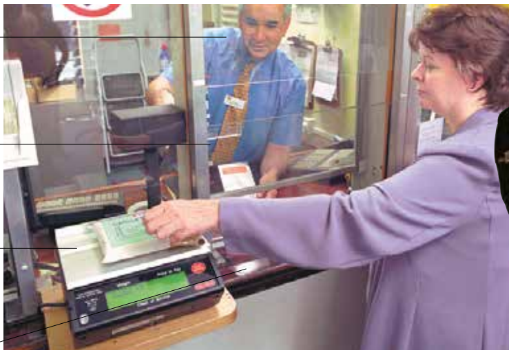
la poste | pošta