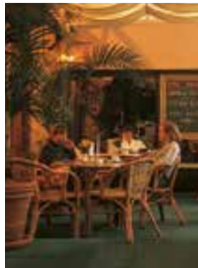
le restaurant restoran