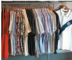
les vêtements pour homme muška odeća