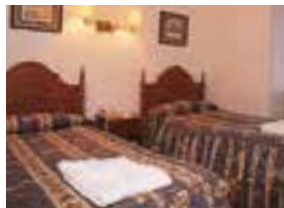
la chambre à deux lits dvokrevetna soba