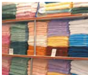
la linge de maison posteljina