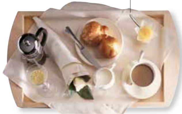
le service d'étage | rum servis