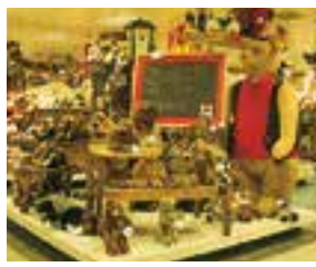
les jouets igračke