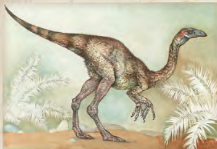
• ORNITOMIM •

Nismo morali dugo da čekamo na prva otkrića. Uzbuđeni krik profesora Smerzbija odveo nas je do fosila ornitomima, dobro očuvanog u steni. Istovremeno sam se oduševio i prestravio od mogućnosti da vidim živ primerak. Možda sam prvo osetio potrebu da pobeegnem u brda, ali to bi izazvalo opšte negodovanje, pogotovo zato što mi je zadatak bio da sve zapisujem. Profesori su se saglasili da mi pomognu tako što će me snabdeti sopstvenim beleškama o nekim poznatim vrstama dinosaura.