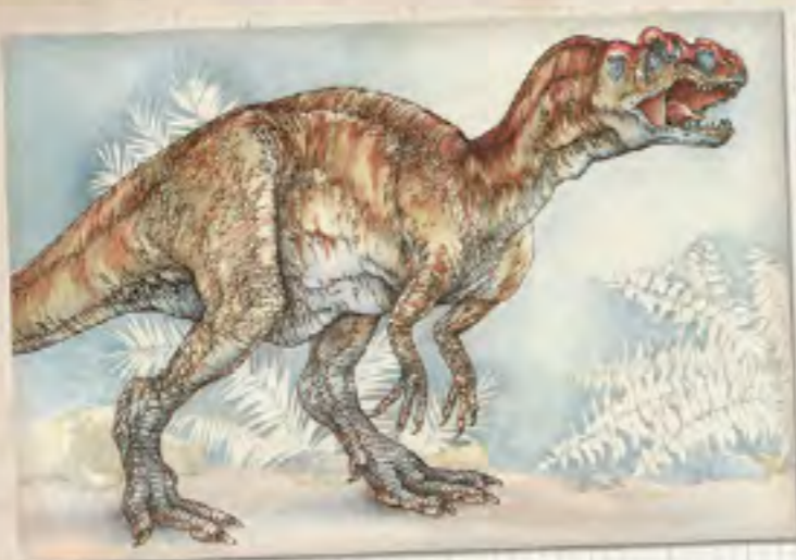
• ALOSAUR •

Uz dinosaure smo приметili i pripadnike nekih savremenih vrsta. Ostrvo je prava evolucionna svaštara!