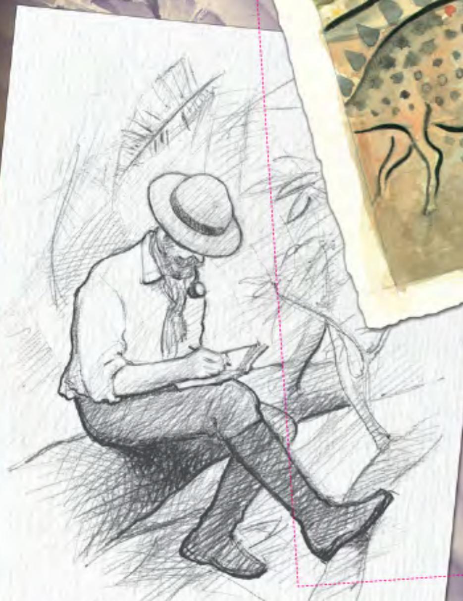
Pukovnik se odmara nakon celodnevnog pešačenja.