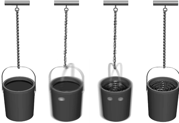
Slika 2.1 Površina vode isprva je ravna i ostaje takva neko vreme pošto kofa počne da se obrće. Kada i voda počne da se obrće, njena površina postaje konkavna, i biće takva dok god se voda vrti, čak i kada kofa uspori i stane.

rečnikom opisano, iz perspektive golmana, lopta posle dobrog šuta može da mu se približava brzinom od 100 km/h. Iz perspektive lopte, golman se njoj približava brzinom od 100 km/h. Obe tvrdnje su tačne – stvar je samo u perspektivi. Kretanje ima smisla samo kao relativna veličina: brzina objekta se može odrediti jedino u odnosu na neki drugi objekat. To ste verovatno i sami doživeli. Ako sedite u vozu kraj kog je drugi voz i zapazite da se kreću jedan u odnosu na drugog, ne možete odmah reći koji voz se, zapravo, kreće. U opisu ovog fenomena, Galilej se pozivao na prevozna sredstva svog doba – brodove. Ispustite li novčić na brodu koji mirno plovi, udariće o vaše stopalo kao što bi i na kopnu – tako je pisao Galilej. Iz vaše perspektive, s pravom možete reći da mirujete i da to voda teče uz brodsko korito. Kako se iz te perspektive ne mičete, kretanje novčića u odnosu na vaše stopalo biće isto kakvo bi bilo pre nego što ste se ukrkali.