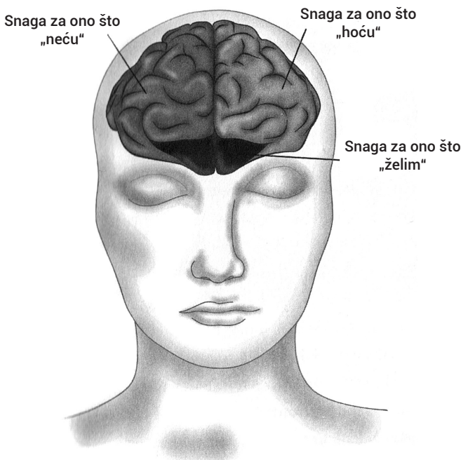
Ishodište snage volje u mozgu

Robert Sapolski, neurobiolog sa Univerziteta Stanford, tvrdi da je glavni zadatak savremenog prefrontalnog korteksa da privoli mozak – pa samim tim i nas – da uradi ono što je „teže“. I kad nam je lakše da ležimo izvaljeni na kauču, prefrontalni korteks nas natera da ustanemo i da vežbamo. Kad je lakše da prihvatimo ponuđeni kolač, prefrontalni kor-