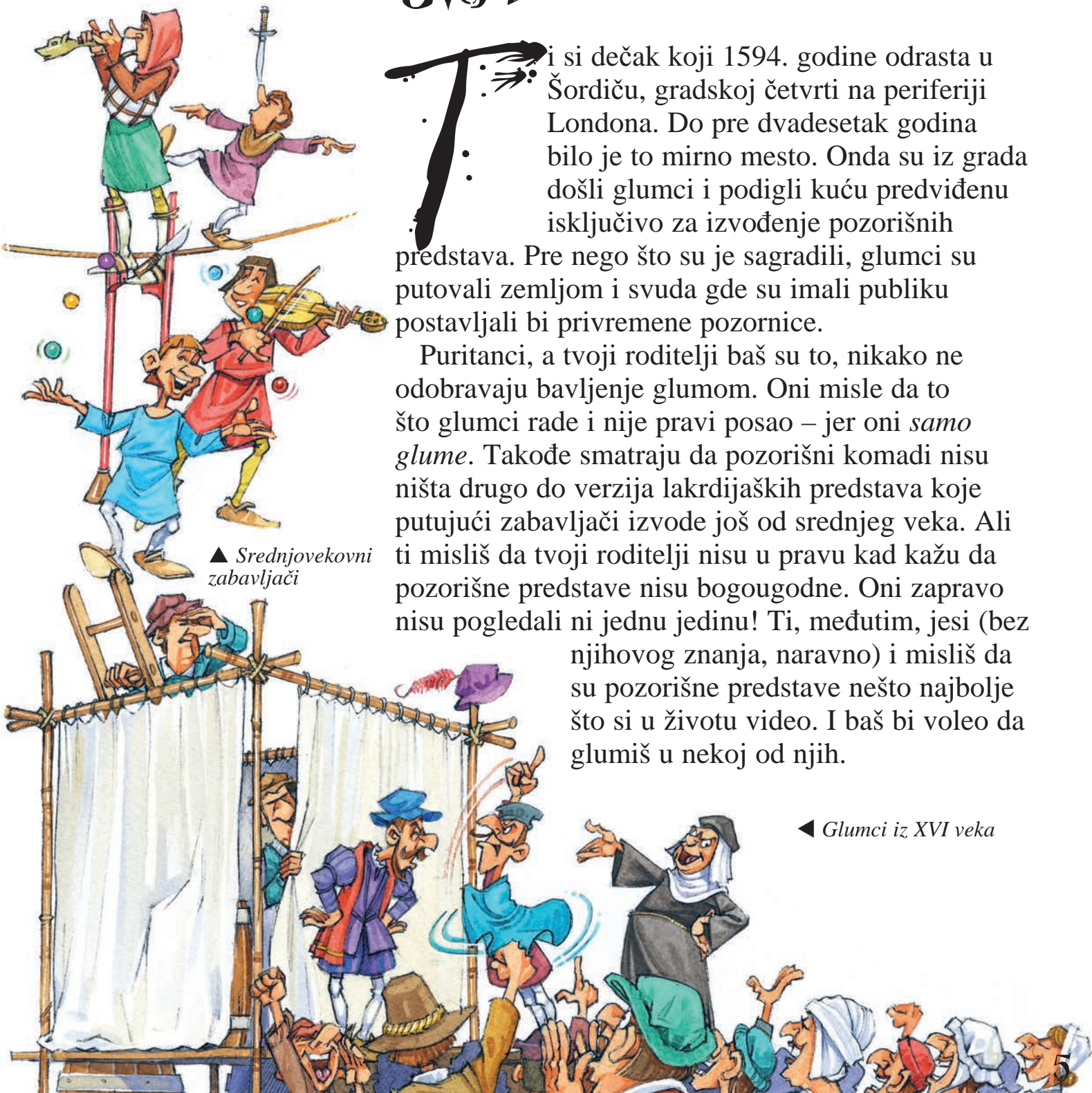
◀ Glumci iz XVI veka