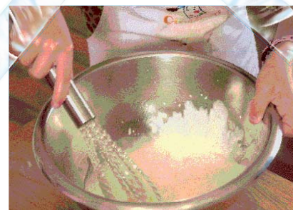
Умутим слатку павлаку иако да се претвори у шлај.