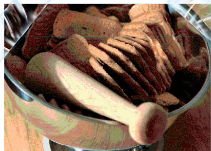
Набави 24 спекуласа.