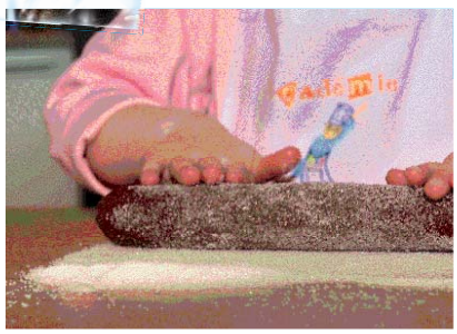
Уваљај га у бели шеќер.