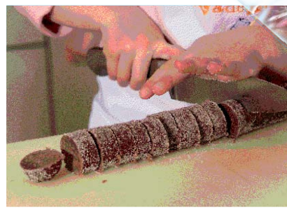
Исеци га на колутилове.