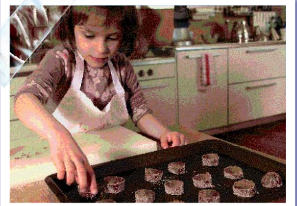
Поређај колутилове на плетх да би се испекли.