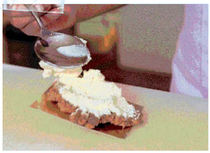
Прекриј шестом шлагом.