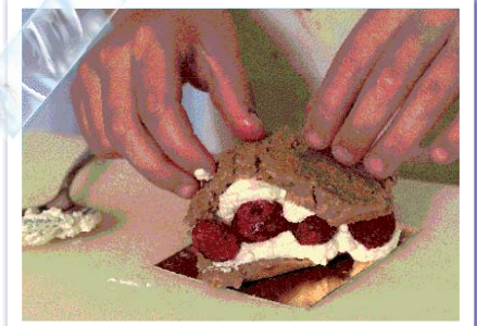
Онда све то прекриј шестом.