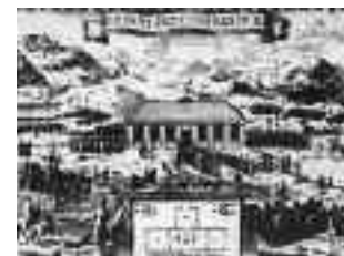
Зграда у којој је поштомисан мир у Карловцима 1699. године

2002–2004. године. Пронађено је насеље неандерталске популације из периода око 50–45 000 година пре Христа, 2. млађе камено доба (неолит) – из периода старчевачке и винчанске културе. Налази су потврђени на локалитетима: на Петроварадинској тврђави и на Темеринској петљи (од 5500–3500 година пре Христа), 3. Енеолитске културе: од 3500–2000 године пре Христа, на Петроварадинској тврђави и Темеринској петљи, 4. Бронзанодобне културе: како на Петроварадинској тврђави, тако и на више локалитета на ширем подручју Града, 5. Прелаз из млађег бронзаног у старије гвоздено доба 1100–950, потврђен је налазом некрополе спаљених покојника на месту нове зграде Библиотеке Матице српске, 6. Налази из старијег и млађег гвозденог доба (Халштат и Латен), од 800–почетак нове ере, потврђени су на више налазишта. 7. Римска војска је окончала освајање Балканског полуострва гушењем тзв. Панонско-далматинског устанка у првој деценији првог века после Христа. Панонија постаје самостална римска провинција већ 10. године по Христу, тиме се територија данашњег Срема нашла у оквиру Римског царства. Временом су Римљани подигли дуж десне обале Дунава читав систем утврђења (Лимес) и тиме је преостало домородачко становништво било под утицајем процеса романизације. Археолошка истраживања на месту Петроварадинске тврђаве потврдила су пос-