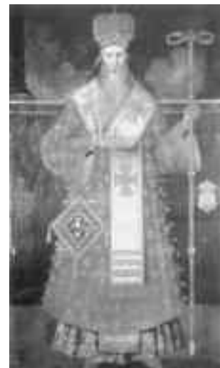
Арсеније III Чрнојевић

Сам град Нови Сад са околним насељима, као и другим крајевима јужне Бачке и обронцима Фрушке горе, богат је археолошким налазиштима из свих епоха