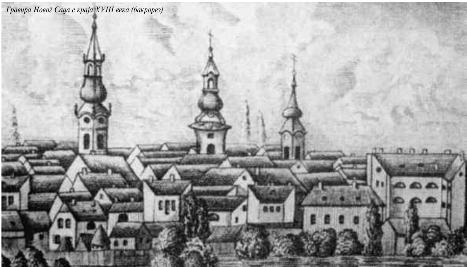
Гравира Новоџ Сага с краја XVIII века (бакрорез)