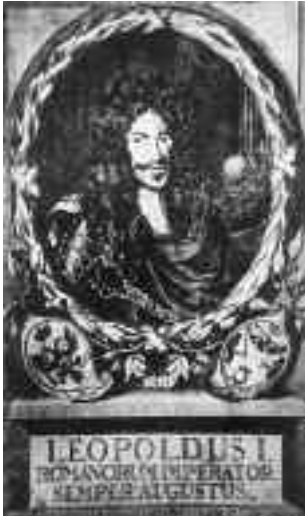
Цар Леополг I

прошлости, почев од старијег неолита па до краја средњег века. Истраживања на подручју Новог Сада и околине, односно прве податке о овдашњим старинама у овим крајевима, прикупљао је још гроф Марсиљи, 1697. године. Истраживања је обавио на подручју Ченеја, а резултате је публиковао на латинском језику, у делу које се бави истраживањем старина и фортификација наших крајева. Ископавањима на подручју града се бавио и већ помињани Ердунђели, који је у „Историји...” презентовао налазе до којих је дошао. Међутим, његове тезе треба узимати са великом резервом, поготово имајући у виду неке ставове и тумачења који нису плод дубље и свестраније анализе (примера ради, на страни 31, „Историје Новог Сада”, стоји: „У почетку седмога столећа дођоше Хрвати, мало после њих Срби...”). Било је и доста случајних налаза, а о неким од њих писала је и тадашња новосадска штампа, попут „Браника” 1893. године, који бележи проналазак скелета на месту данашњих зграда Матице српске и Библиотеке Матице српске („Хански плац”). Систематских археолошких истраживања на подручју Града и његове ближе околине, никада није било. Сва су била заштитног карактера, која су, уз случајне налазе, више него недовољна. Археолошка истраживања, организована у оквиру образовних институција и установа заштите: Институт за историју Филозофског факул-